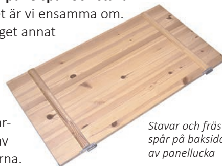
Stavar och frästa spår på baksidan av panellucka