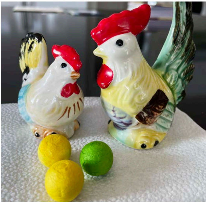
PÅSK. Nu är påsken snart här och det är dags att pynta. En läsare delar med sig av den här fina bilden!