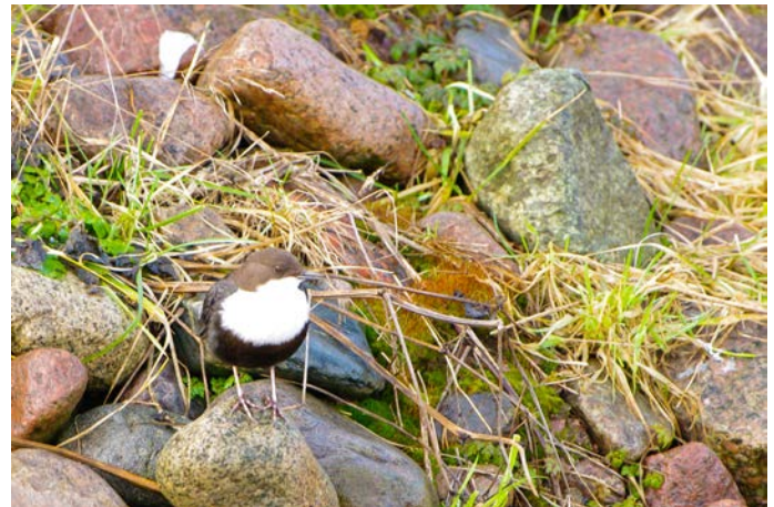
Strömstaren var på plats vid Karlshammar.