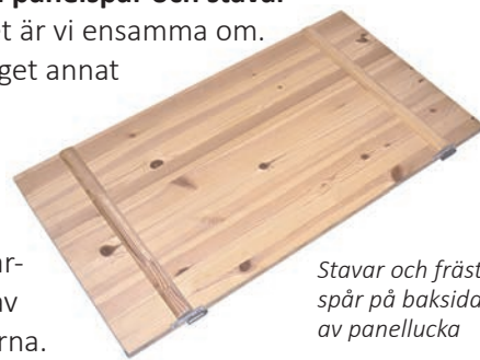
Stavar och frästa spår på baksidan av panellucka