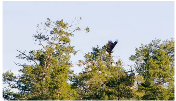
En havsörn sågs vid Spänget på Nötö.