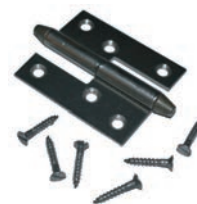
Gångjärn skruvas med spårskruv