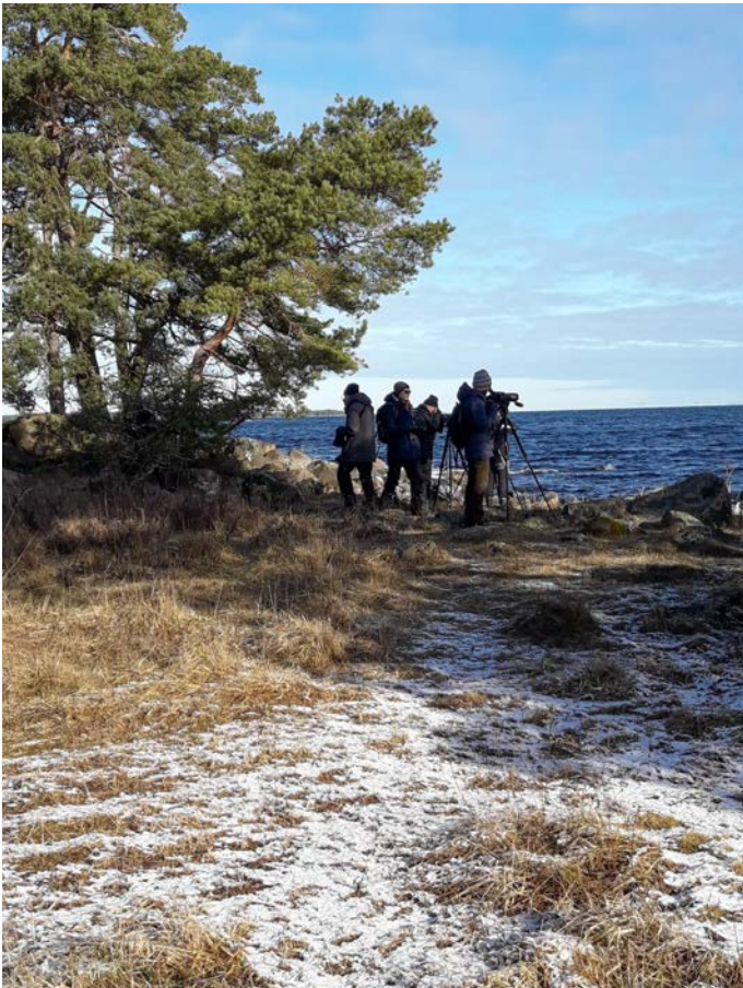
Fågelskådare på jakt efter vårfåglar.