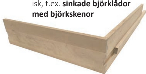
Sinkade björklådor med björkskenor

Vi har nu kompletterat de ursprungliga modellerna, med Basebo och Shaker. Vi levererar kök och badrumsinredningar som inte bara ser traditionella ut på utsidan utan de ska även på insidan ha en design och funktion som är tidstypisk, t.ex. sinkade björklådor med björkskenor