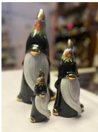
En mycket populär tomtetrio.