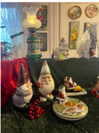
Tomtetätt på bordet.