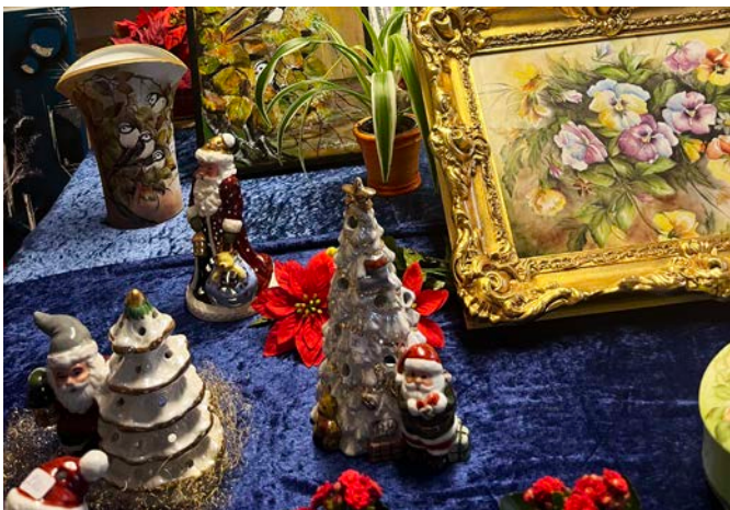
Här kan du hitta fina julklappar till både stora och små.