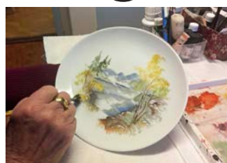
Efter tre minuter med penseln...

lugn och ro, säger hon och slår ut mot platsen där hon brukar sitta.