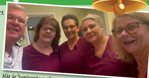
Här är "seniorgänget", som du ofta träffar hos oss.