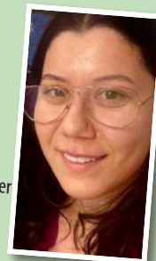
Berlinda kommer och jobbar så ofta hon hinner.