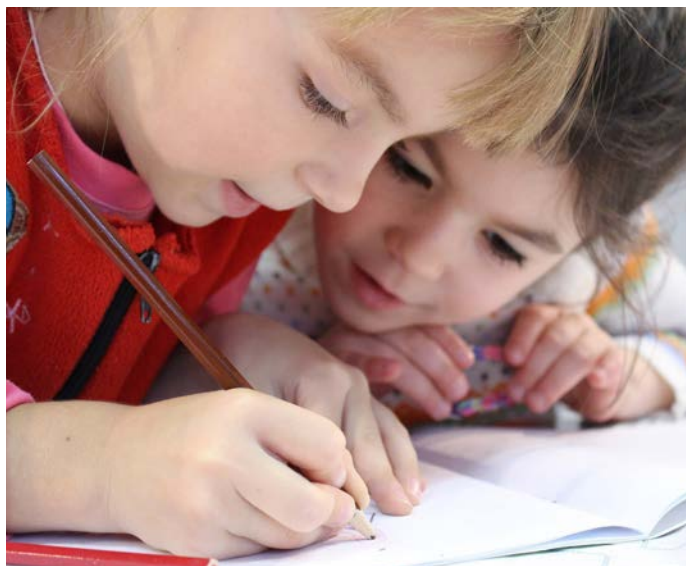
SKOLSTART. Nu är snart sommarlovet slut. Måndagen den 21 augusti startar höstterminen för skolor i Mönsterås kommun.