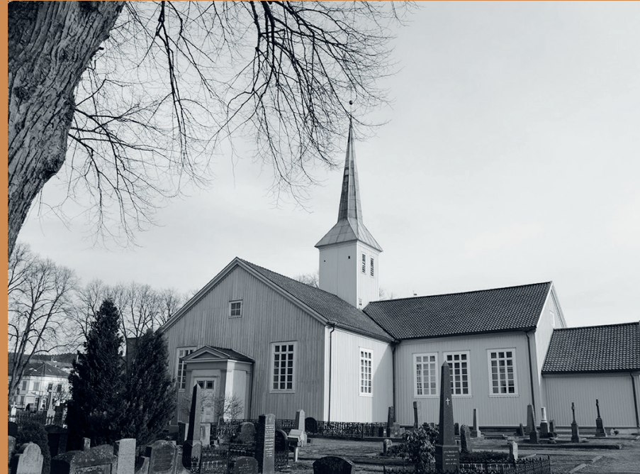
Strømsø kirke er Drammens eldste kirke. Fremover skal den, utover kirkelige handlinger, brukes som Åpen kirke , med blant annet konserter, kunstprosjekter og kulturarrangementer.