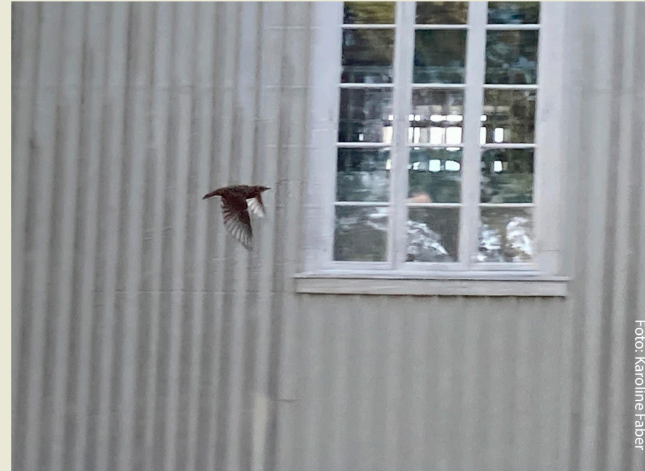
En trekkfugl fanget av prestens kamera på en høstdag utenfor kirken.

Strømsø Kirke | Tordenskiolds gate 58A, 3017 Drammen tlf: 32 98 91 00 | epost: kf565@kirken.no