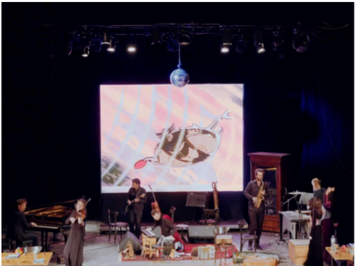
Brunteti - The Return, Marjanishvili Theatre, Tbilisi