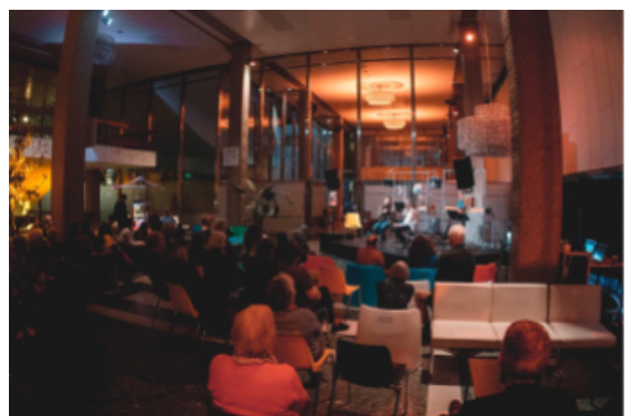
aftertalk Perceived Reality, de Doelen, Rotterdam