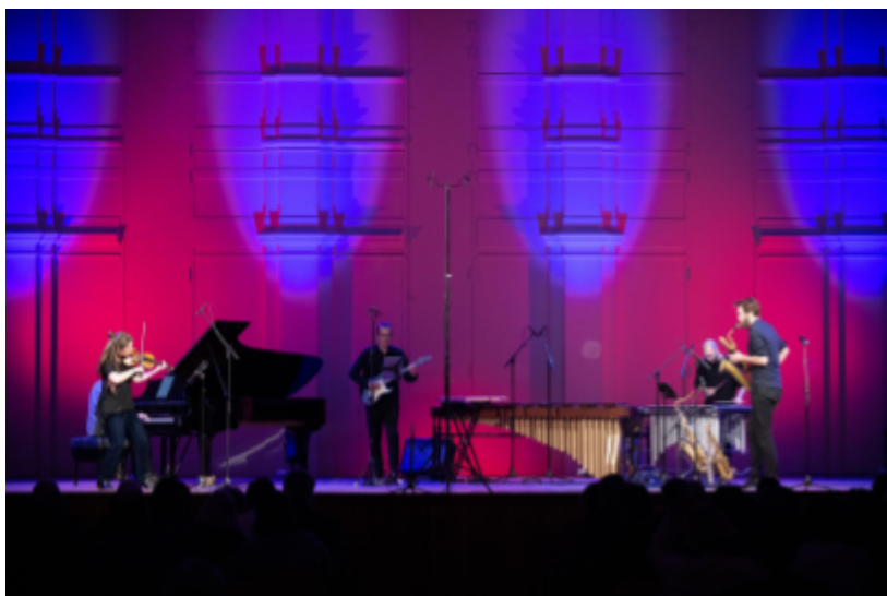
Andriessen Festival, Muis, Arnhem

Het concert werd afgesloten met opnieuw een werk van Andriessen. "Hout", een dynamisch en energiek werk geschreven voor tenorsaxofoon, marimba, elektrische gitaar en piano die perfect de kenmerkende stijl van de componist weergeeft.