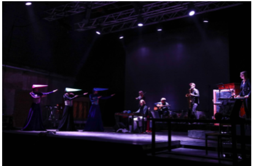
Brunteti - The Return, Silk Factory Studio, Tbilisi, Georgië

werd zes keer uitgevoerd in Tbilisi: vier keer in het uitverkochte Haraki Theatre en twee keer in de eveneens uitverkochte Silk Factory Studio. Het publiek werd betoverd door de unieke combinatie van muziek, theater en visuele kunst, wat zorgde voor een onvergetelijke ervaring. De voorstelling bracht niet alleen entertainment, maar ook educatieve waarde en historische context, wat het publiek inspireerde en hen meenam op een onvergetelijke reis door de ogen van een kind. De succesvolle uitvoeringen en de enthousiaste reacties van het publiek benadrukten de impact en de aantrekkingskracht van deze innovatieve benadering van muziektheater. #internationaal #Interdisciplinair #geschiedenis #educatie #fantasie