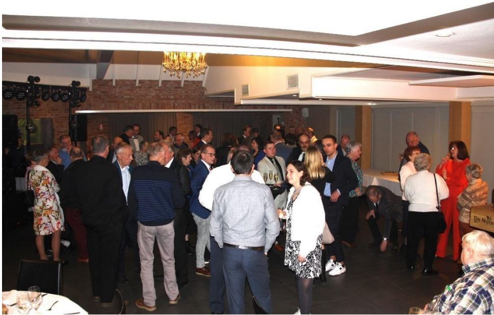
BANKET 02 maart 24