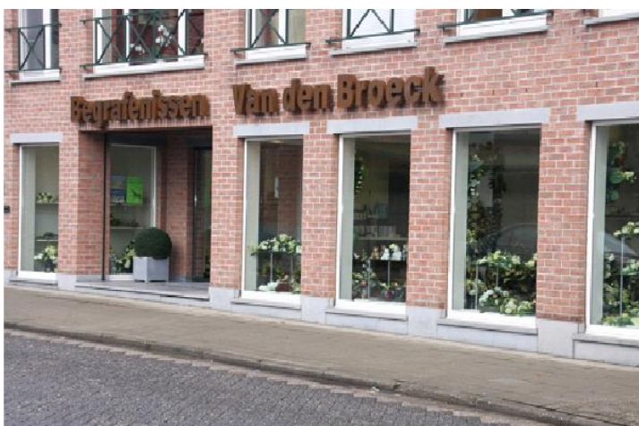
Begraafnissen - Crematies - Funerarium Riemenstraat 1-3 2290 Vorselaar - 014/88.16.96