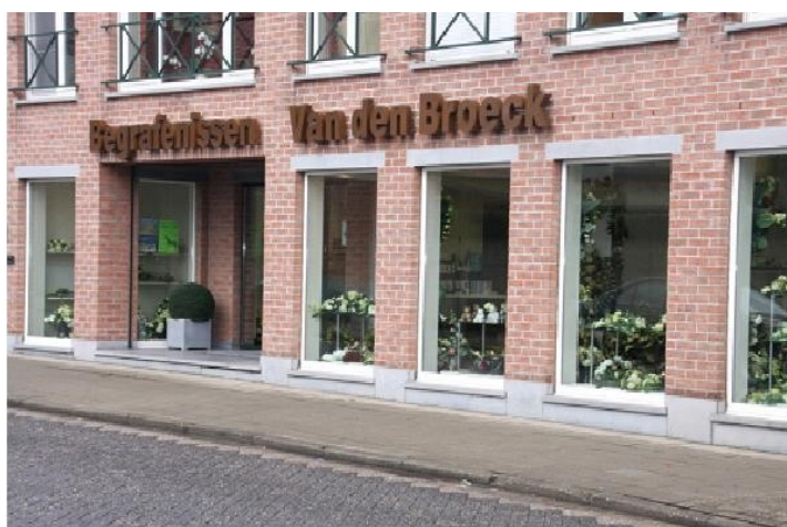
Begraafnissens - Crematies - Funerarium Riemenstraat 1-3 2290 Vorselaar - 014/88.16.96