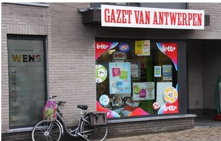
Dagbladhandel Wens Molenstraat 6 - 2290 Vorselaar 014/51 29 22