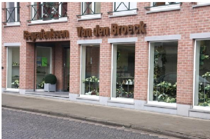
Begravenissen - Crematies - Funerarium Riemenstraat 1-3 2290 Vorselaar - 014/88.16.96