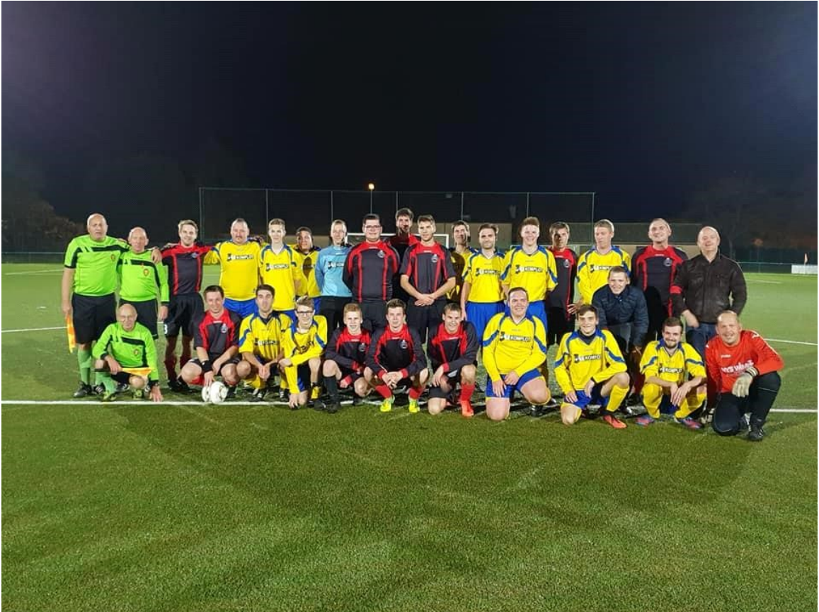
Het leidende trio