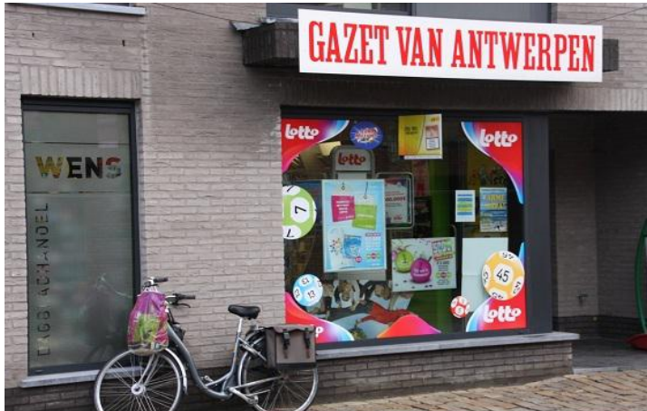
Dagbladhandel Wens Molenstraat 6 - 2290 Vorselaar 014/51 29 22