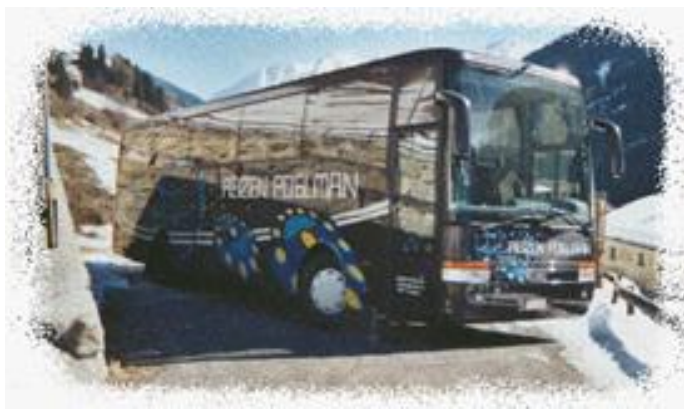
Reizen Poelman Ronic bvba – tel. 014/ 51 21 40 Goorbergenlaan 45 – 2290 Vorselaar – fax. 014/ 50 24 07