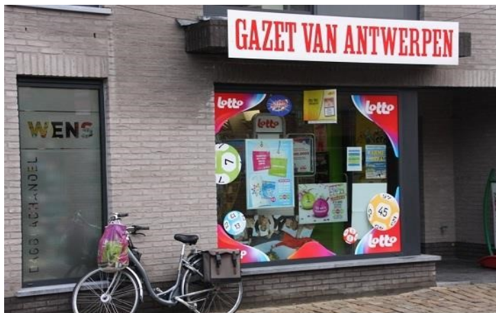
Dagbladhandel Wens Molenstraat 6 - 2290 Vorselaar 014/51 29 22