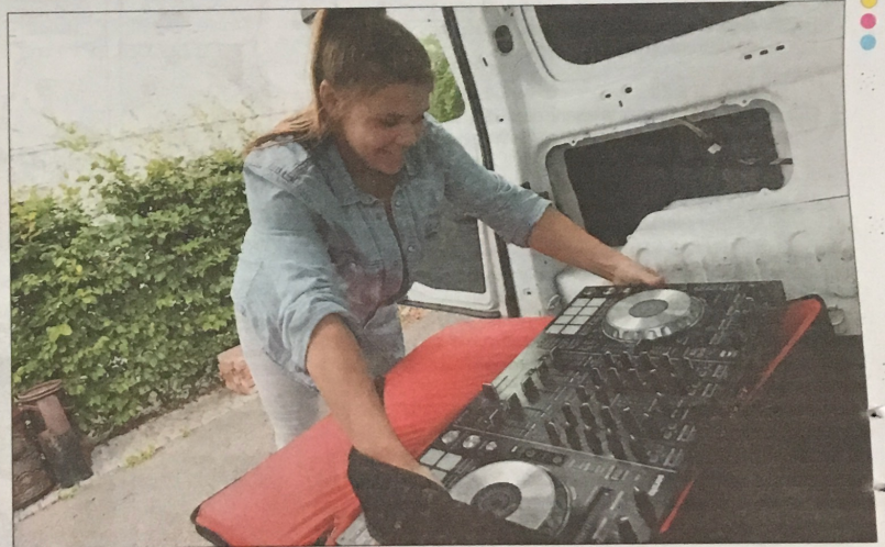
TILFELDIG: Musikk har alltid vært interessen over alle interesser. At hun nå har sitt eget firma som DJ og musikkprodusent hadde hun ikke sett for seg.