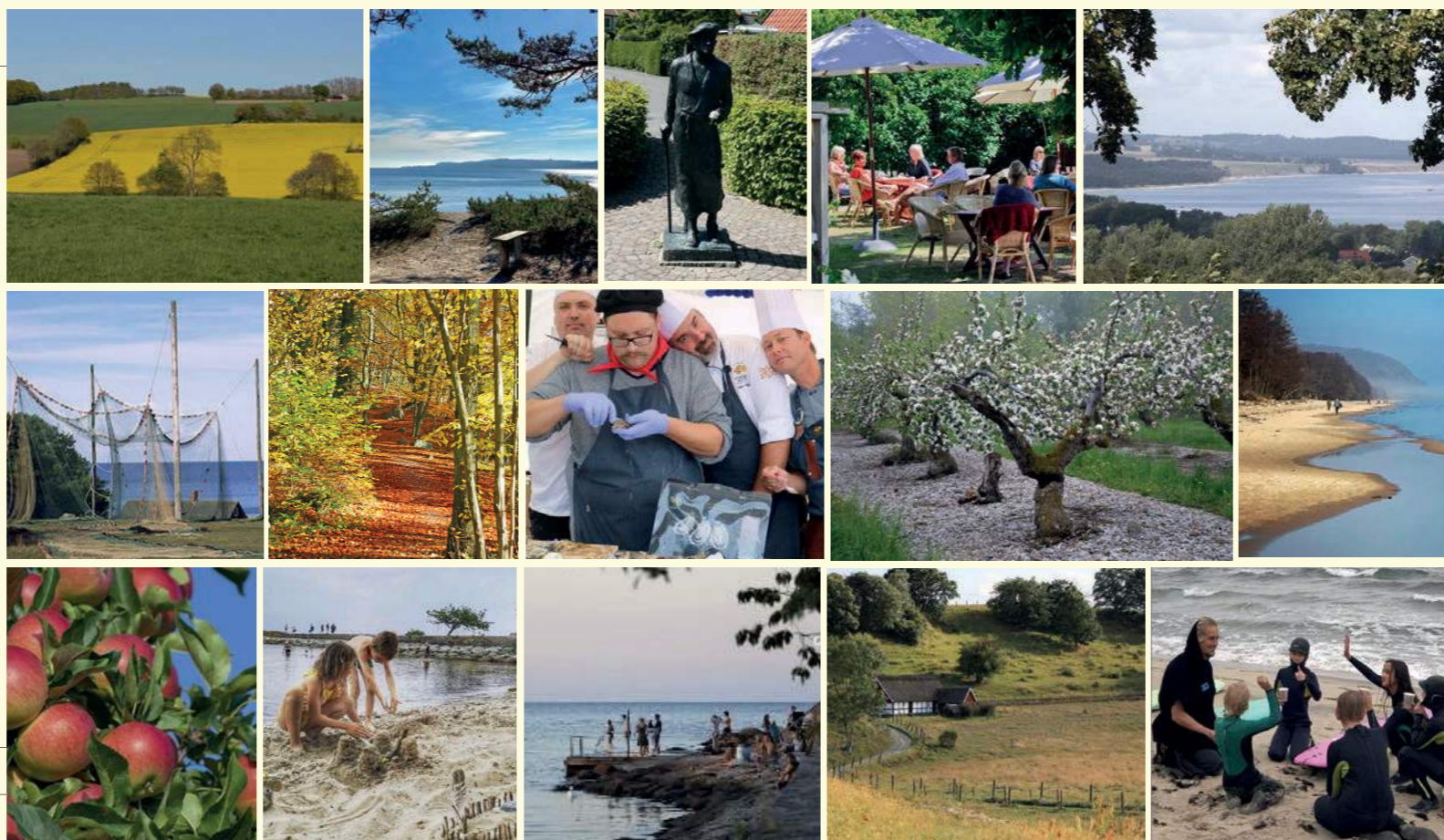
Flera av bilderna kommer från Kiviks Turisms fototävling på Instagram. Alla bilder är tagna i de vackra, lokala omgivningarna runt Kivik.