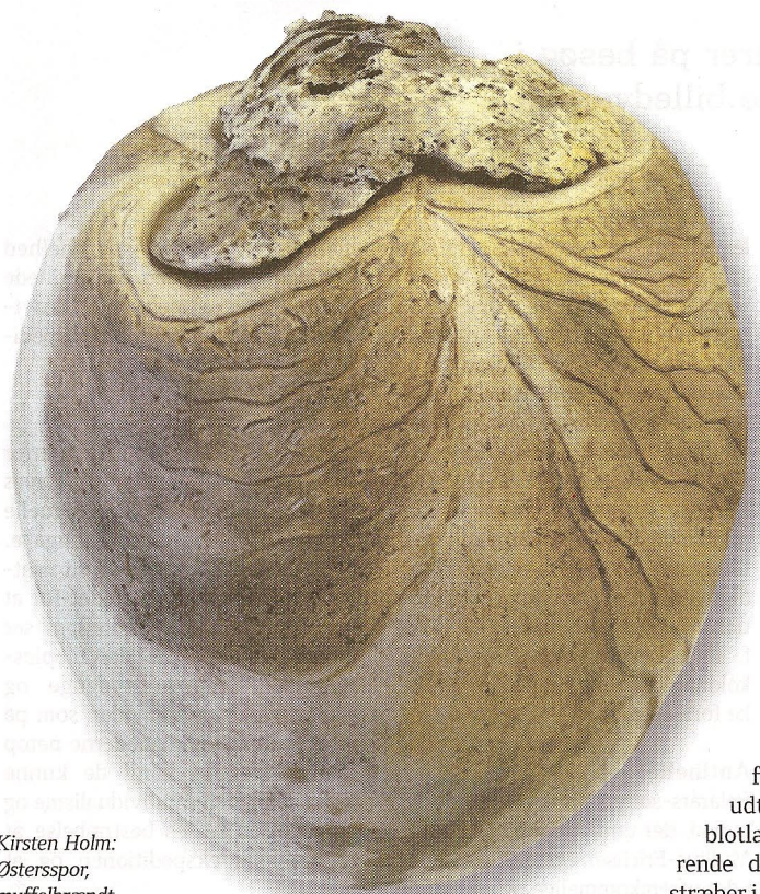
Kirsten Holm: Østersspor, muffelbrændt keramik.