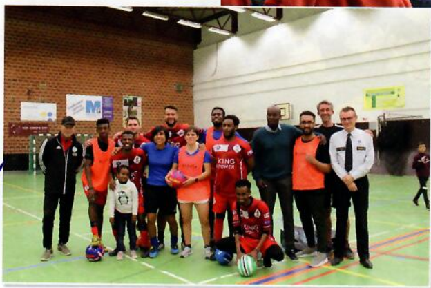
*De Partij voor Kindergelijkheid (PKG) is een initiatief vanuit het Leuvense Jeugd-en Welzijnsoverleg (JWO) en bundelt de stem van kinderwerkings Fabota, Casablanca en De Kettekeet onder leiding van vzw Link in de Kabel

sen die overtredingen doen, moet ik aanspreken of soms een boete geven als ze in fout zijn. Ik ga ook langs bij mensen thuis om te kijken of ze wonen op het adres dat ze zeggen.