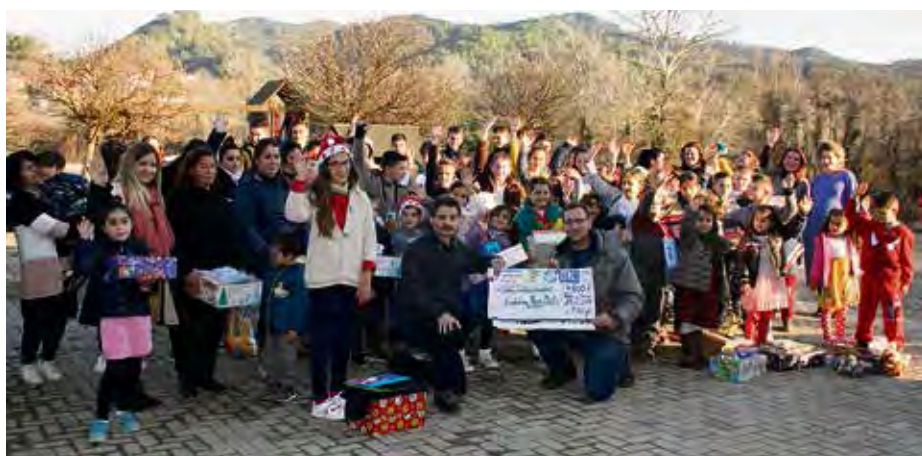
Freude über Spendenscheck