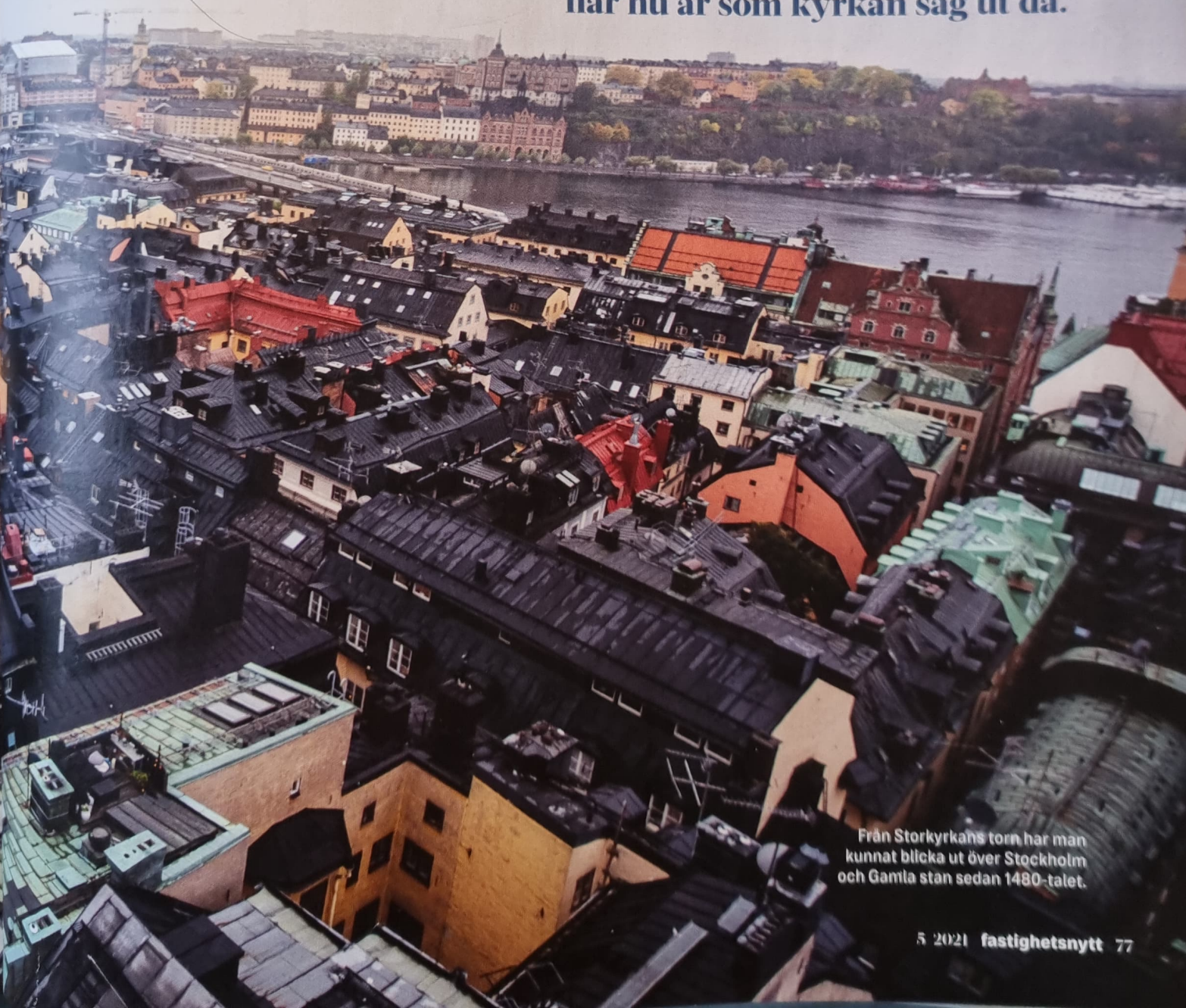
Från Storkyrkans torn har man kunnat blicka ut över Stockholm och Gamla stan sedan 1480-talet.

”I deras arkiv hittade vi en bit från 1740-talet, så vi vet med 100 procents säkerhet att den kulör vi har nu är som kyrkan såg ut då.”