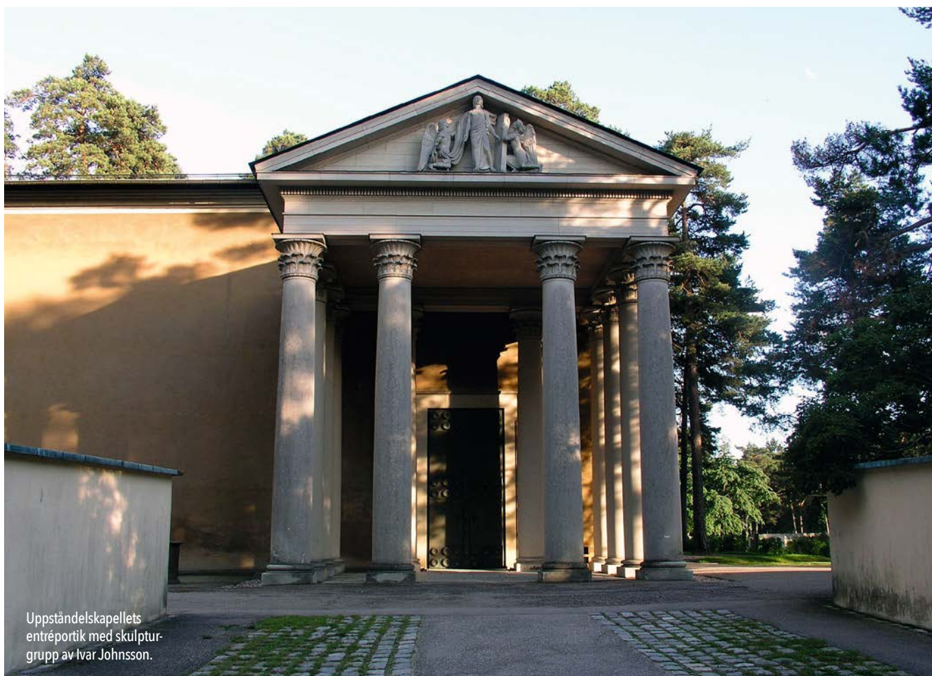
Uppståndelskapellets entréportik med skulptur- grupp av Ivar Johansson.