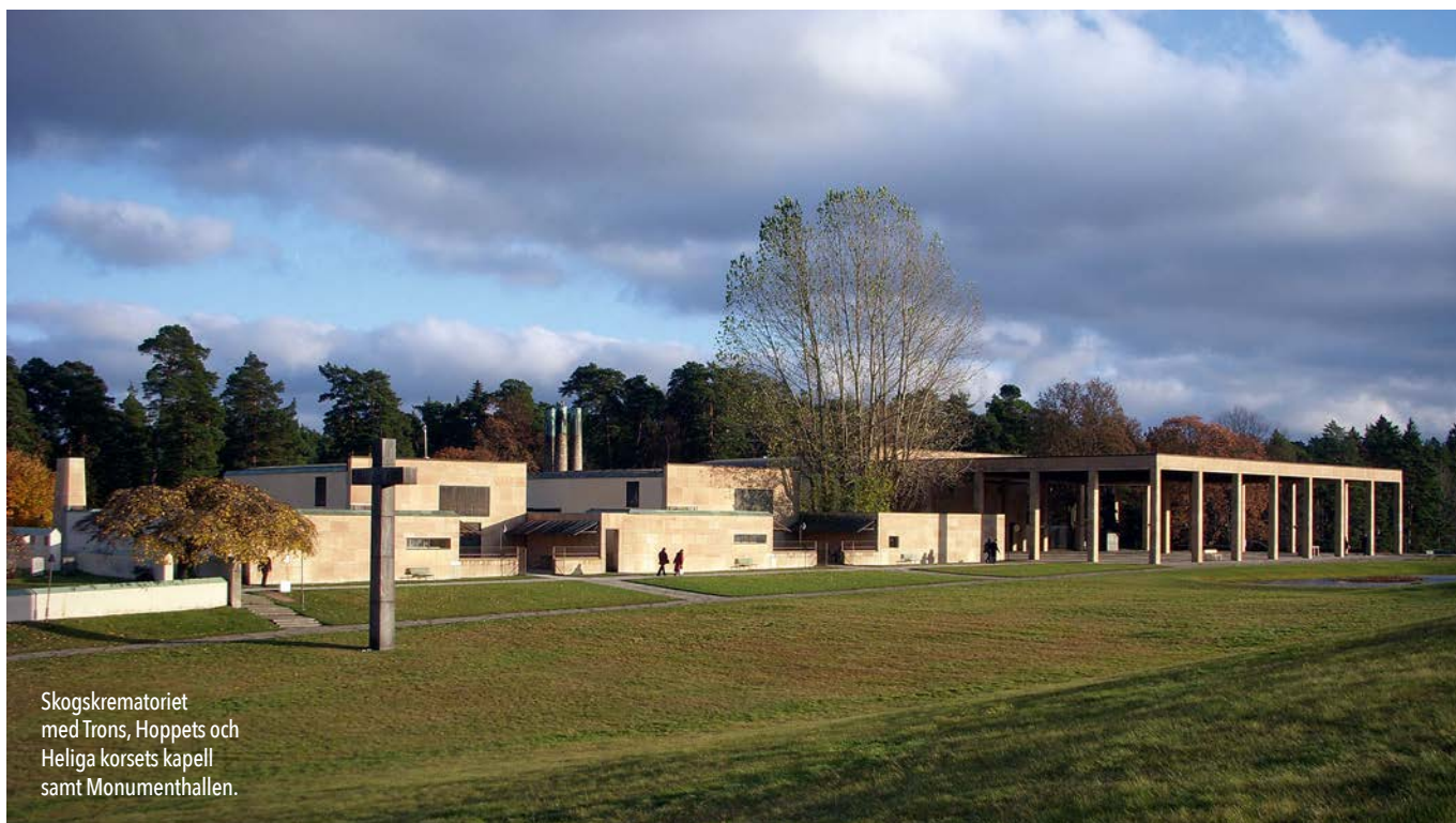
Skogskrematoriet med Trons, Hoppets och Heliga korsets kapell samt Monumenthallen.