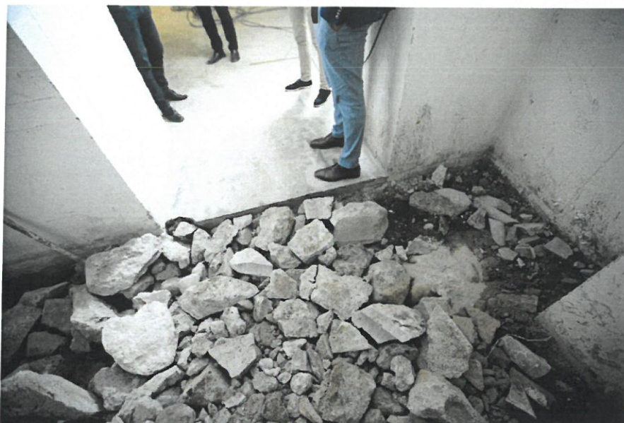
En del utrymmen som tidigare har varit oanvända kommer nu att iordningställas.