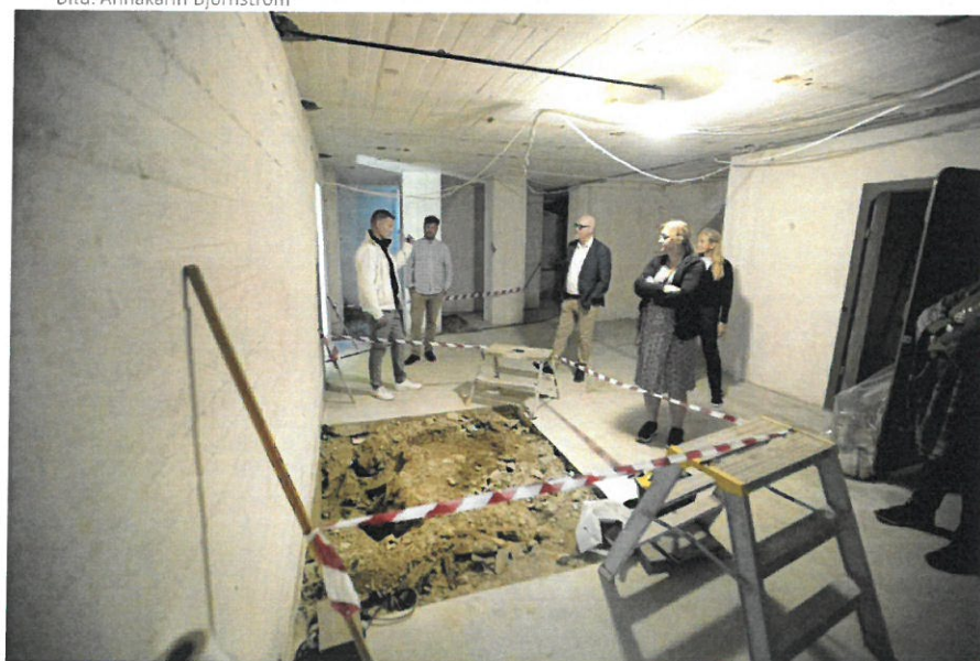
I källaren kommer det bland annat att byggas foajé och toaletter.