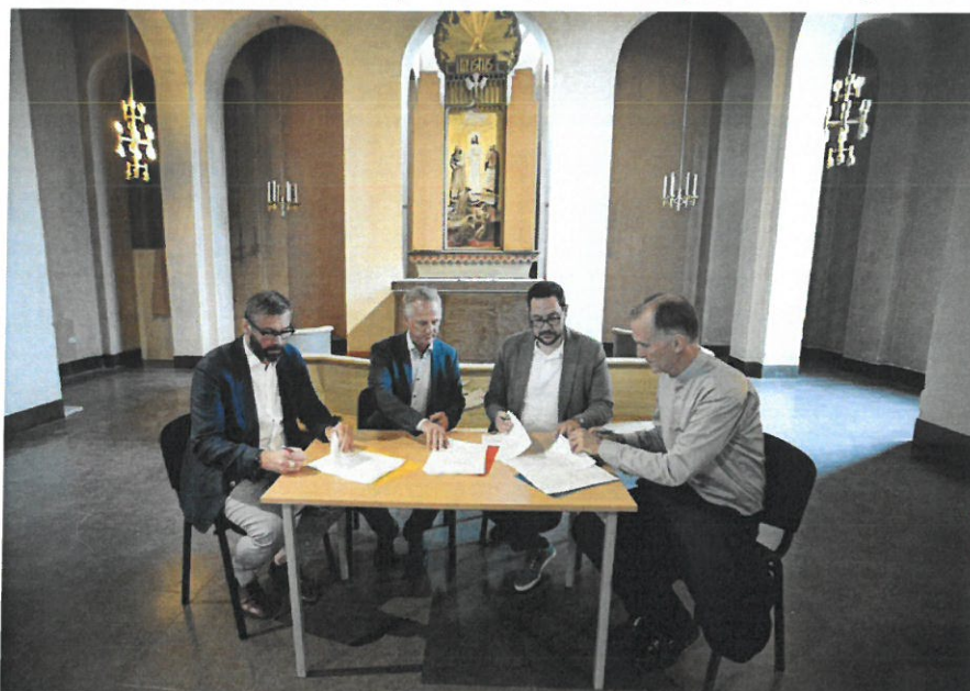
På torsdagen skrevs kontraktet på. Projektverkstaden kommer att vara ansvariga för projektet.