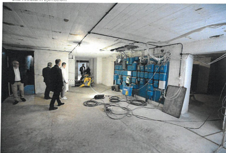
I källaren blir det bland annat ett nytt kök.