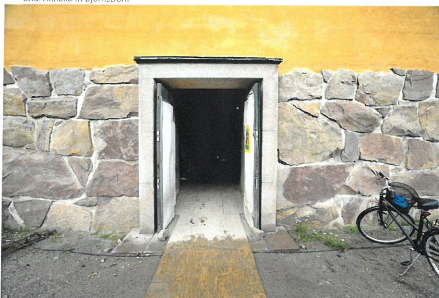
Porten på baksidan av Staffans kyrka leder in till det som kommer att bli nya församlingslokaler.