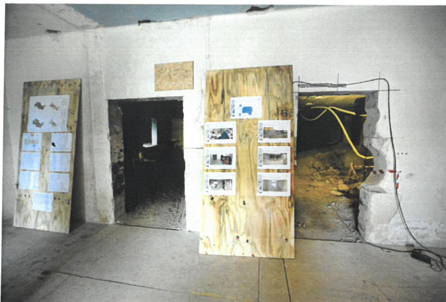
Väggen mellan de båda källarutrymmena ska rivas och ge plats för en 150 kvadratmeter stor lokal.