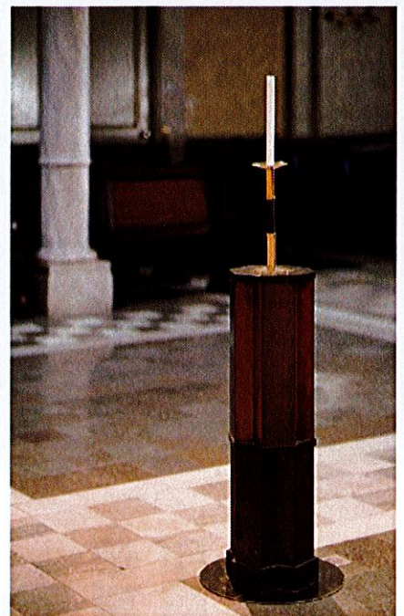
▲ Heltäckningsmattan från 1960-talet har plockats bort, vilket gör att gångarnas mönstrade stengolv framträder.