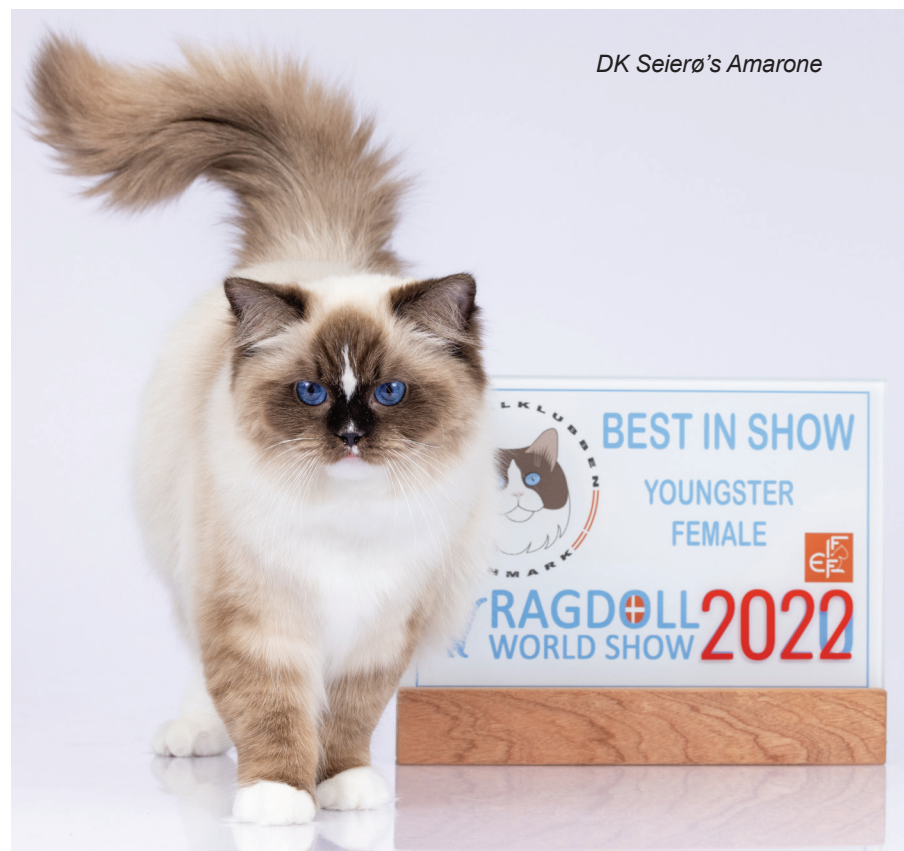
DK Seierø's Amarone

Efter Best in Show var det tid til hygge og netværk efter en lang dag. Lørdag aften blev der holdt international showmiddag med 75 deltagere på Restaurant Flammen i Kolding. Det blev en skøn aften, hvor snakken gik på kryds og tværs. Mange nye bekendtskaber blev skabt og gamle venner kunne endelig mødes efter en lang periode, hvor vi ikke har kunnet mødes på shows. En skøn afslutning på en helt fantastisk dag i ragdollens tegn.