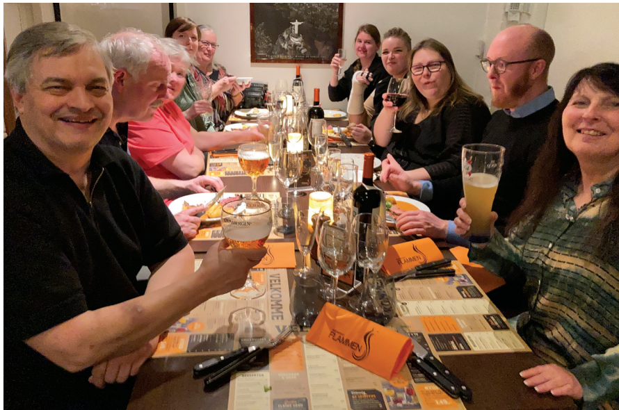
Højt humør til Ragdoll Show Dinner

pede og så var det bare skønt, at vi endelig kunne mødes igen på tværs af grænser.