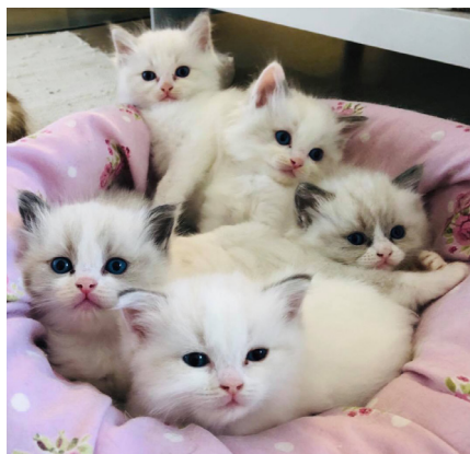
En kurv fuld lækre Ragdoll killinger.

Jeg glæder mig rigtig meget over, at der stadig er en stor efterspørgsel på racekatte killinger. Det er en positiv udvikling og jeg håber, at vores arbejde med at informere og oplyse om fordelene ved at købe racekatte, fortsat udvikler sig så fint som det gør ligenu. Det gavner udbredelsen af racekatte i Danmark.