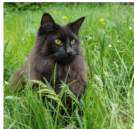
PR DK Silverleaf's Batman, Norsk Skovkat.

Skulle du få brug for hjælp, så har DARAK nogle yderst kompetente konsulenter. Charly Riis & Jan Krag, vores genetik konsulenter er gerne behjæl-