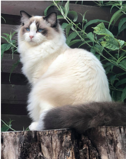
Ritual Nekonomicon*PL, Ragdoll.

har du nogle rigtig gode billeder af din race, som vi må bruge til vores racepræsentationer eller i andre medier? Så send gerne dine billeder i god kvalitet til webmaster@darak.dk .