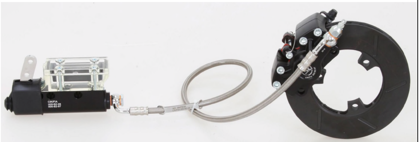
Photo vue de dessus du système complet / Photo from above of complete system