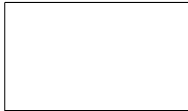
ပြည်ထောင်စုအထိမ်းအမှတ်တံဆိပ်

၂၅၃။ (က) ပြည်ထောင်စုအထိမ်းအမှတ်တံဆိပ်သည် အောက်ပါအတိုင်းဖြစ်သည်။