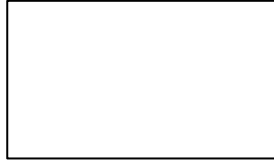
ပြည်ထောင်စုအလံ

၂၅၂။(က) ပြည်ထောင်စုအလံသည် အောက်တွင်ဖော်ပြထားသည့်အတိုင်းဖြစ်သည်။