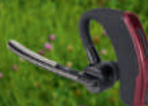
H-Set Bluetooth Headset