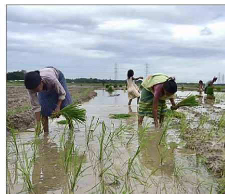
I byarna planterar man ris vid den här årstiden. Varje planta sätts för hand.

Det har regnat i några dagar i Jharkhand. Det är bra för jordbrukarna.