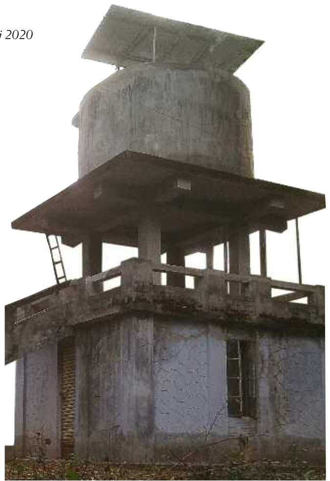
Vattentornet med solcellspanelerna högst upp.

sel. Den går igång när solen träffar cellerna och går så länge solen lyser. Även molniga dagar kan pumpen gå med lägre varv, om det är tunnare moln. När tanken blir full, bryter nivåvakten strömmen.