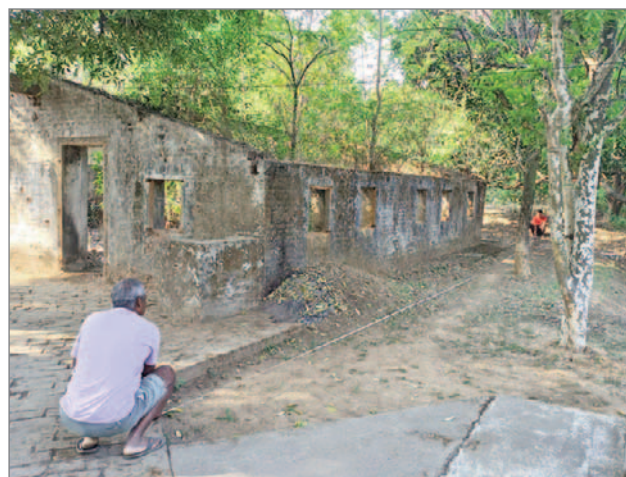
Vincent mäter upp hur mycket rör som går åt till den planerade vattenledningen mellan köket och skolan.