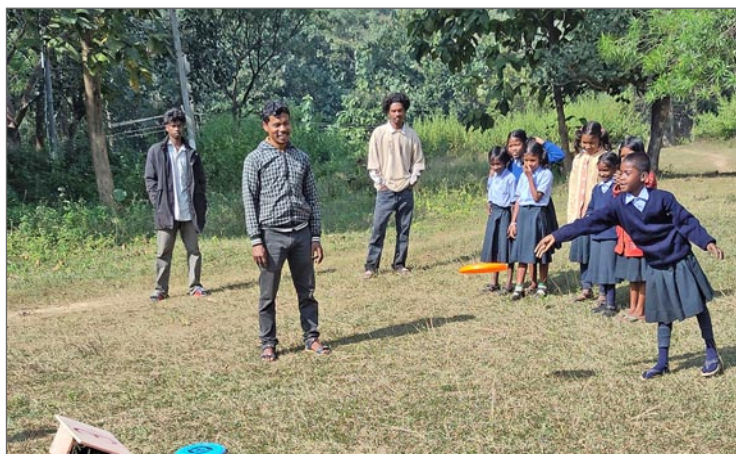
Skolan har en väl tilltagen skolgård, men skulle behöva fler lekgrejer.