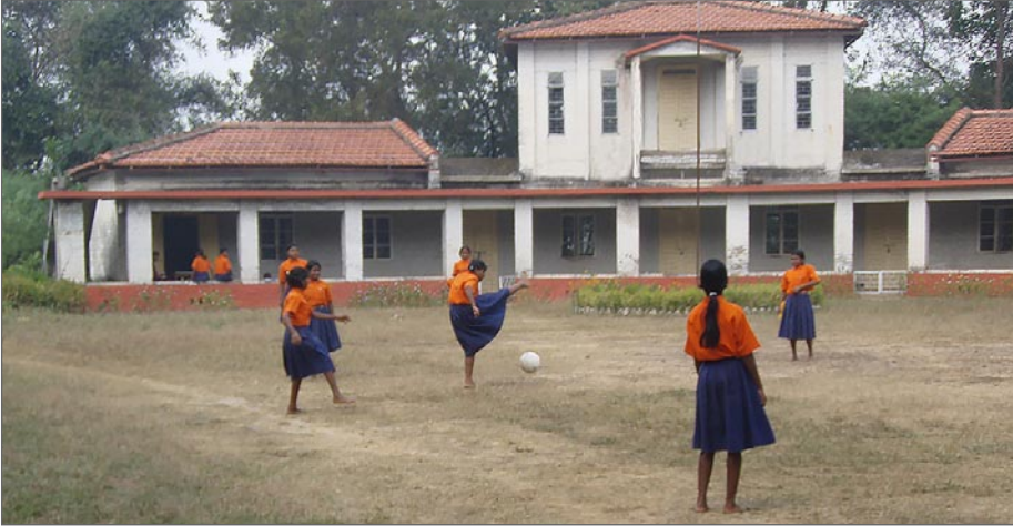
Tänk att Jagriti Vihara inte bara har lett till framstående kvinnliga politiska ledare, utan också till att man kan se flickor som spelar fotboll på skolgården.

Skolbyggnaden på Jagriti Vihara är ju så vacker och numera också fylld med skolbarn under dagarna. Nu tycker lärarna att det skulle vara fint om man också kunde utrusta den stora skolgården med pedagogiska lekredskap och idrottsmateriel. Det tyckte vi i JVV-styrelsen också och hoppas att du vill ge en JULGÅVA i form av ett bidrag, som vi