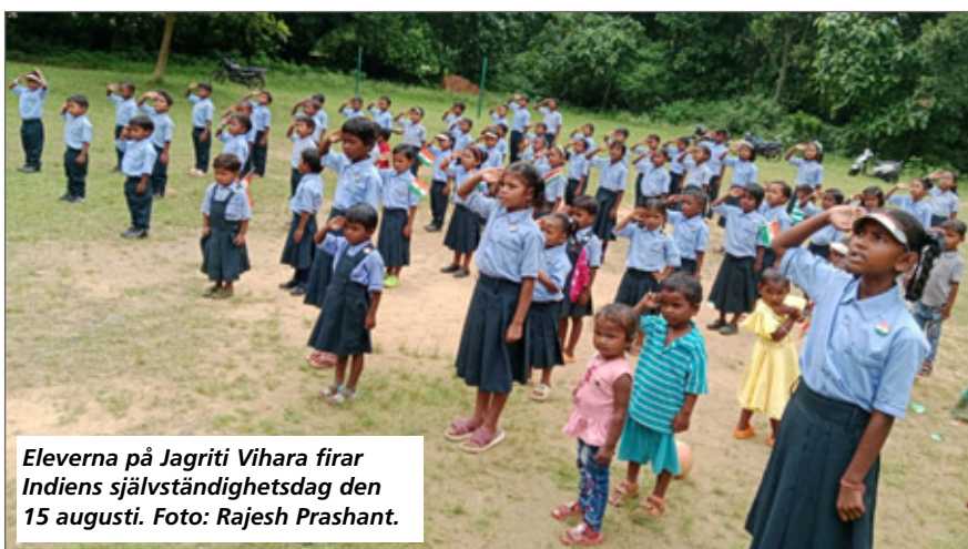
Eleverna på Jagriti Vihara firar Indiens självständighetsdag den 15 augusti.