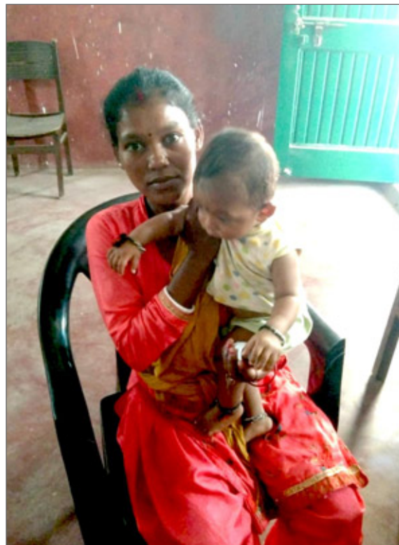
Sjukstugan på Jagriti Vihara är öppen varje dag. Personer från byarna som behöver hjälp kommer och får träffa en sjuksyster, som finns där dagligen, eller en läkare som i allmänhet kommer en dag varje vecka.