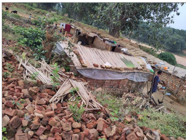
Tegelbruken breder ut sig runt centret.