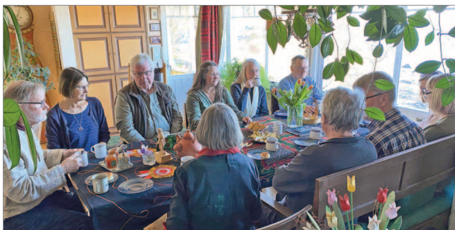
Årsmöteslunch i hemmiljö.