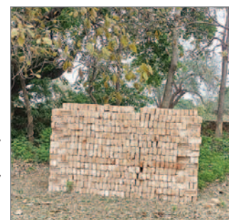
Material är inköpt till renoweringen av toaletterna vid skolan. Här ligger tegelstenar och väntar på arbetskraft.