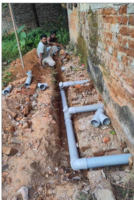
Skolbarnens toaletter restaureras.

När man varit där en vecka och börjar komma in i och försöka förstå, så ser man ljusglimtarna bakom alla träd. Skolan, som byggdes under vårt första besök, var fortfarande vacker, och barnen lekte glatt på skolområdet, spridande glädje och framtidshopp. Toaletterna var under reparation, och vatten med handfat hade dragits fram till skolgården – en satsning som troligen