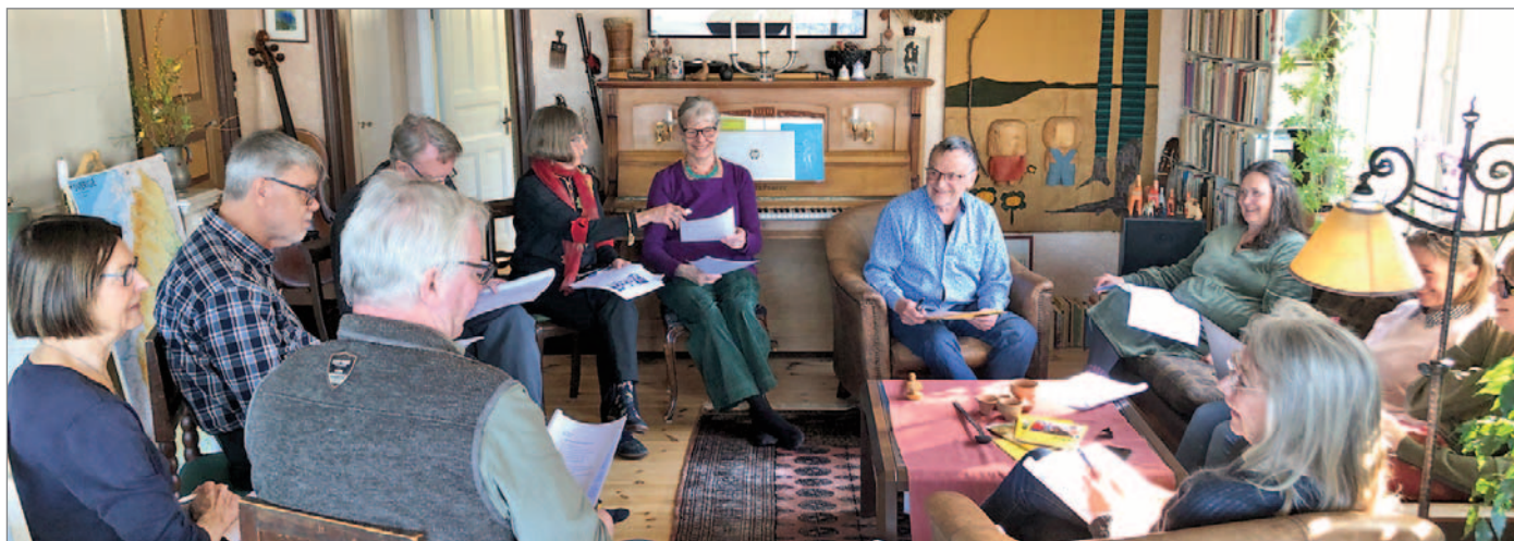
Årsmötesförhandling i hemmiljö.

E tt år innehåller 52 veckor. Tänk dig att det varje lördag under ett helt år, såväl vinter, vår, sommar som höst, var dags att träffas för att samtala. Det tycker jag ger ett perspektiv åt Jagriti Viharas Vänners liv. Under de 52 år som föreningen haft sina årsmöten tror jag samtliga ägt rum på en folkhögskola, ofta i Ljungskile. Denna gång bröts den trenden då vi den 22 mars i år blev inbjudna