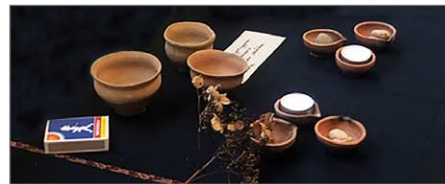
Lerskålar från Dumaro.

Vägbeskrivning med mera skickas ut till dem som anmäler sig till mötet.