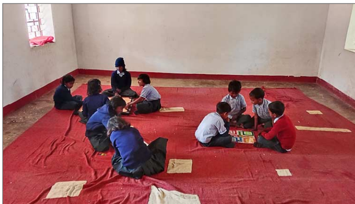
Spelgrupper. JV-elever lär sig de nya spelen.