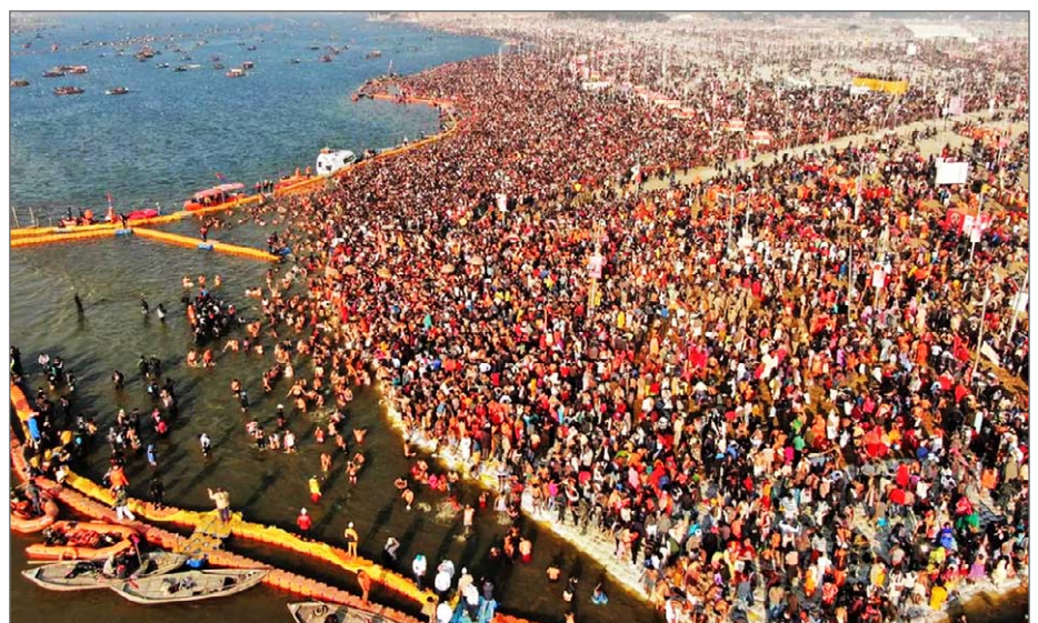
Maha Kumbh Mela (urnans stora fest) i Prayagraj 2025.