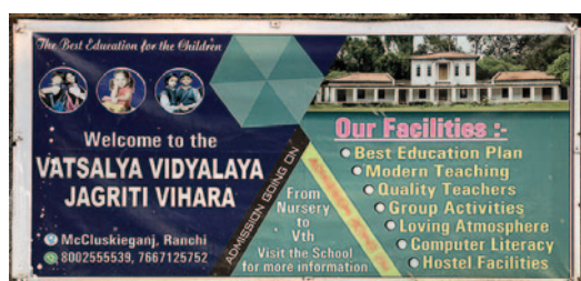
Skylden vid JV:s entré.

När vi besökte skolan nu i november kände vi direkt den goda atmosfären. Lärarna lugna och vänliga. De mindre barnen satt på golvet på en röd matta och arbetade intensivt med att forma bokstäver i den latinska alfabetet, A, B, C osv. I ett annat klassrum satt lite äldre barn i bänkar. Deras lektion var en övning att svara på frågor på engelska, som stod skrivna på svarta tavlan. I ett tredje klassrum ännu äldre elever som läste och skrev i böcker och