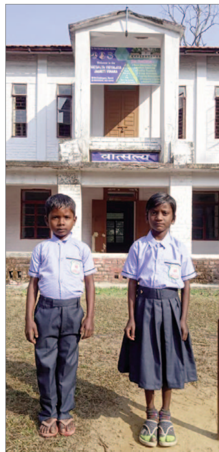
Nya elever. Högtidligt allvar. December 2023.

Vi vet inte om regeringen kommer att hjälpa till, men vi ska knacka på dörren för att få dess stöd.