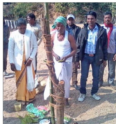
Ceremoni vid flaggan.

Att folk i Indien firar alla tänkbara högtider, oavsett vilken religion de tillhör, har vi förstått. Julen, till exempel, firas med mäktiga dekorationer i städerna i detta hinduiska land. Det blir gott om lovdagar i skolan, eftersom högtiderna i olika religioner är utspridda under året, och alla iakttas.