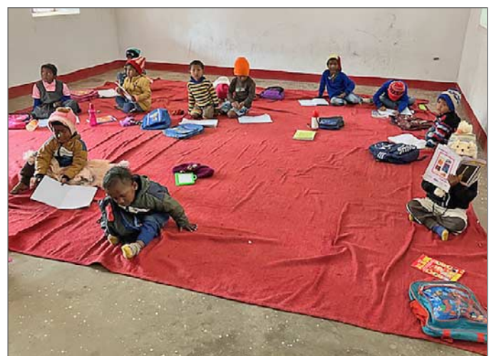
De yngre skolbarnen sitter på golvet.