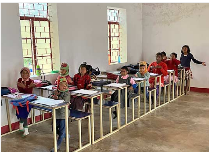
Besök i skolan. De större barnen sitter i bänkar.