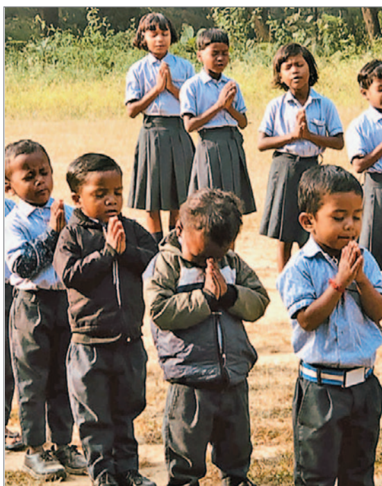
Dagen inleds med bön.