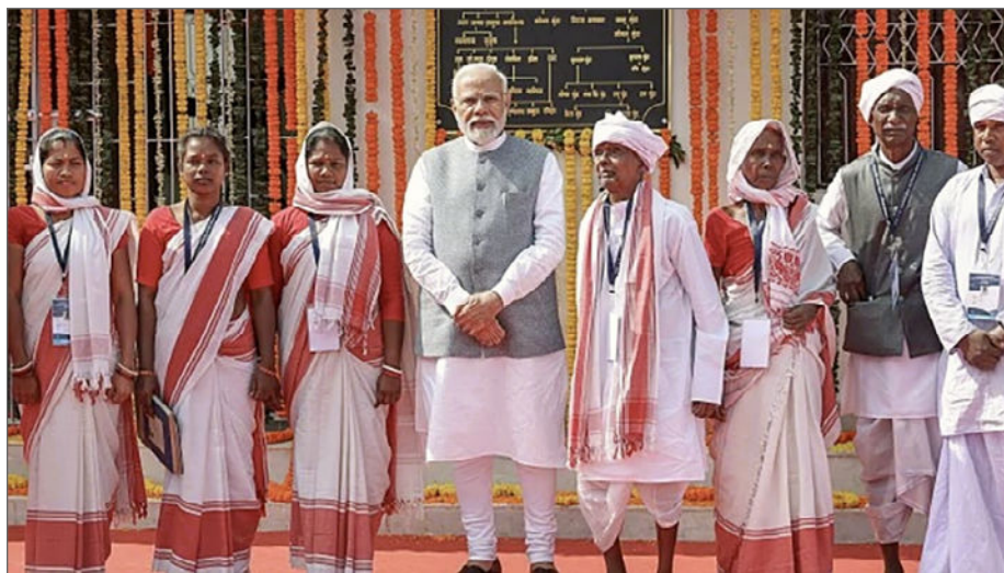
Premiärminister Narendra Modi poserar gärna tillsammans med olika folkgrupper. Särskilt när valet närmar sig. Här med adivasikvinnor och män i Ulihaty, frihetskämpen Birsa Mundas födelseort i Jharkhand, november 2023.

Misstro och Bekymmer: Å andra sidan finns det adivasi-grupper som är skeptiska till Modi. De oroar sig för att utvecklingsprojekt kan leda till förlust av deras traditionella markrättigheter och kulturell identitet. Vissa anser att Modi inte har gjort tillräckligt för att skydda adivasi-intressen och att hans regering har ignorerat deras röster.