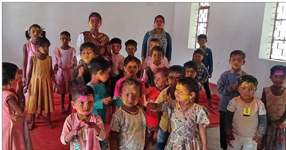
Holi firas över hela Indien. Även på Jagriti Vihara.

Holi är en hinduisk vårfest, som firas i månadsskiftet februari/mars. Vintern är slut, våren kommer och skrattet, leken och glädjen står i centrum. Holi firas till minne av den busige gudahjälten Krishnas upptåg. Den firas i två-tre dagar utomhus. Första dagen tänder man eldar för att jaga bort vinterkylan. Andra dagen kastar man färgpulver eller färgat vatten på varandra under smått kaotiska men glädjefulla former. Då är skillnader i klass, kast, ålder och kön tillfälligt upphävda och man får omväxlande "färgmula" och krama varandra. Holi kallas färgfestivalen.