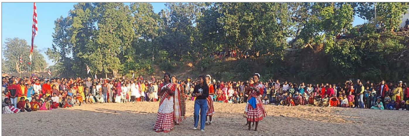
Flodbanken var full av människor, som kommit från byarna för att manifesteras sin aktning för naturen.