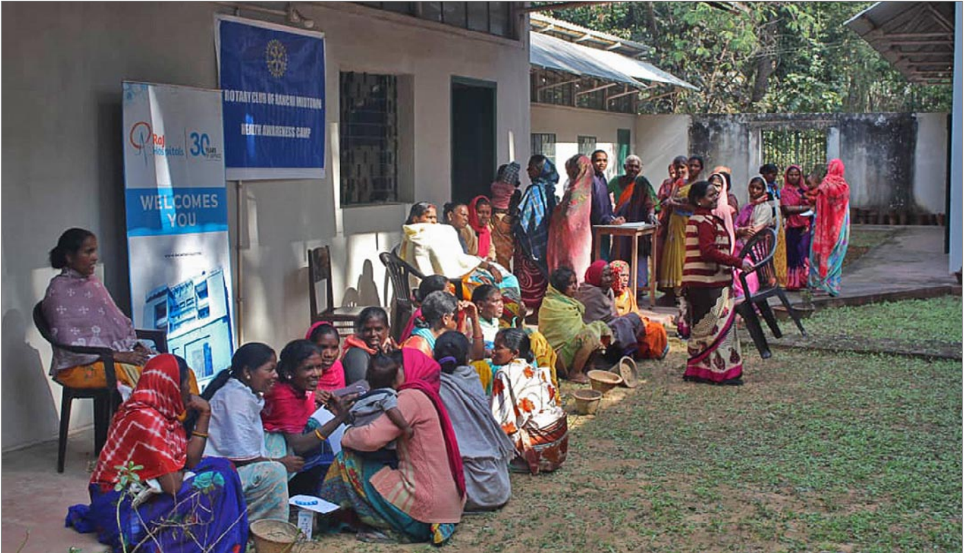
Health Camp januari 2024. Lång kö utanför sjukstugan på Jagriti Vihara. Ett hundratal personer kom från byarna för att få hjälp.

Vård, skola, omsorg – det är begrepp som vi är vana att höra i våra svenska medier och i en ständigt politisk debatt.