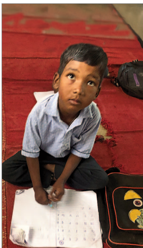
Skolpojke 2024.