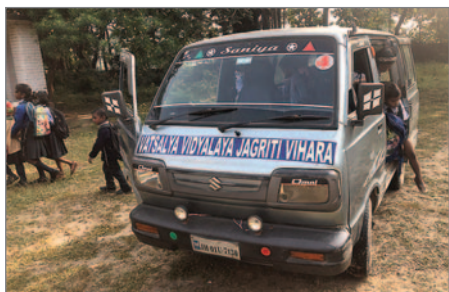
En liten buss får användas för skolskjuts.

På långrasten slog sig barnen ner i grupper i gräset på skolgården och åt sin matsäck. Alla hade en liten låda med sig och en vattenflaska. Skoldagen började vid 8-tiden. Svårt att komma vid exakt samma tid. En del kom gående från närmaste byn Jovia, andra blev skjutsade av fäder på motorcykel. Åter andra kom med skolbuss från byn Dumaro 2 km bort och från byn Chatti Nadi 2–3 km bort. En generös man i trakten har ställt sin skåpbil till förfogande, och mängder av små barn får plats där. De väller ut på skolgården, alla med en stor ryggsäck baktill. Verkar stolta och glada att komma till skolan.