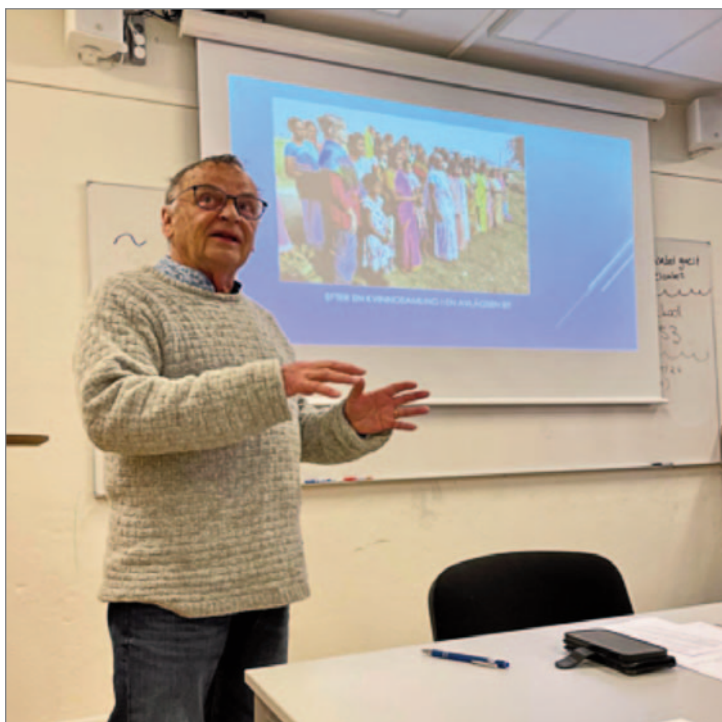
Per berättar om Jagriti Vihara.