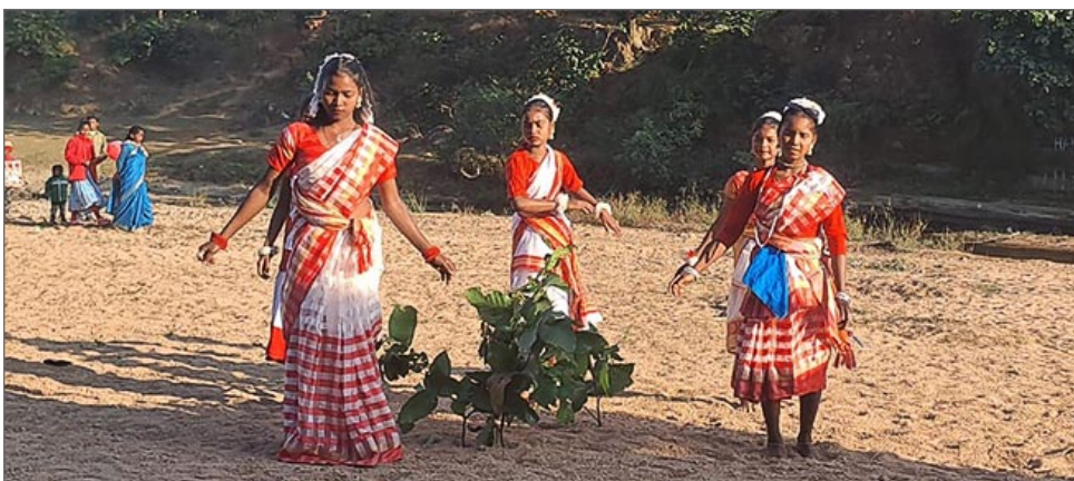
Dans för naturen. Rött och vitt är adivasifolkets och delstaten Jharkhands färger.