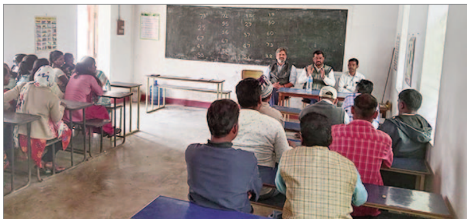
Planering på Jagriti Vihara med föräldrar inför fortsättningen av skolan. Februari 2024.