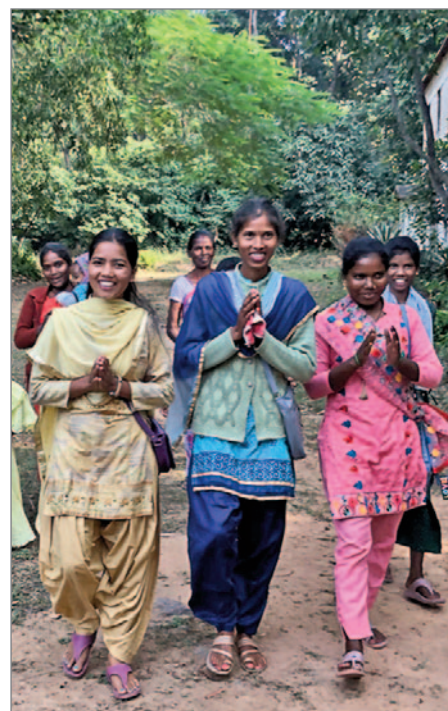
Några flickor från höstadieskolan på JV 2014-2017 kommer på besök.

I flera tidigare nummer av JVV-Medlemsbrevet har vi intervjuat och presenterat några av flickorna. Mer om hur det gått för dem presenteras i kommande nummer.