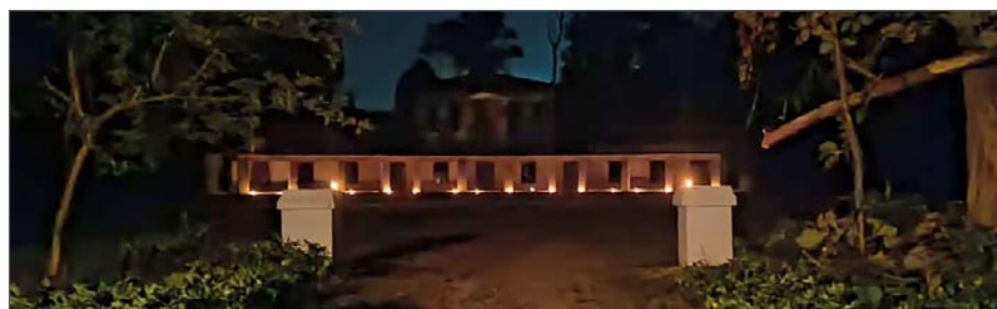
Bilden nedan: Två vita grindstolpar leder in till skolgården. Skolbyggnaden är upplyst.