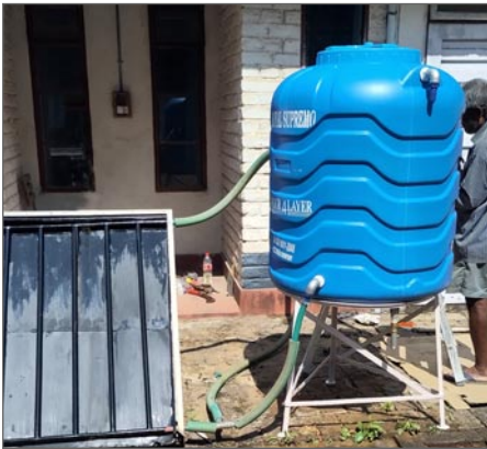
Vattenvärmaren vid Guest Hostel har fått en nödvändig renovering.

För ca 30 år sedan tillverkade vi en vattenpanel för att värma vatten. Den har renoverats ett par gånger