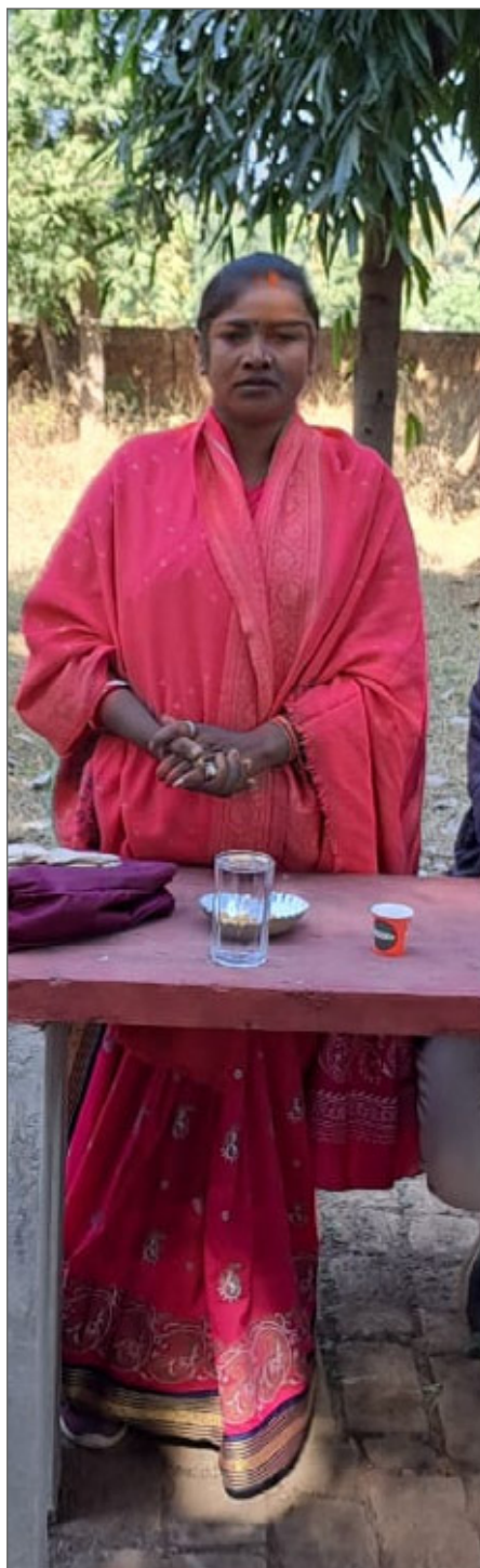
Numera reser sig även kvinnor och talar offentligt.