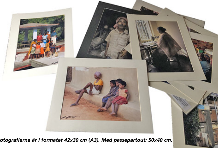
Fotografierna är i formatet 42x30 cm (A3). Med passepartout: 50x40 cm.

U nder höstterminen 2010 följde jag en terminskurs på Ljungskile folkhögskola som kallades Världens kurs. Den genomfördes då som en distanskurs, men de tre veckornas studieresa i Indien var full av närvaro.