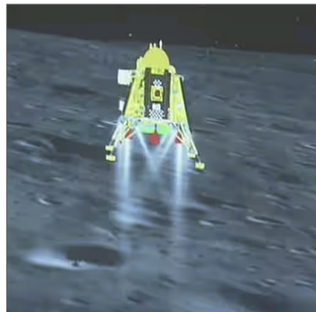
Den indiska månsonden Chandrayaan-3 har landat nära månens sydpol. (Jagriti Vihara är inte inblandad i denna satsning.)

Ni har väl noterat, att Indien framgångsrikt har landat på månens sydpol den 23 augusti klockan 18:04 och skapat historia. Indien blev det första landet att göra det. Det ger möjlighet för forskarna och andra intresserade att lära sig mer om rymden.