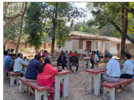
Många bybor kom till Jagriti Vihara för att samtala om centrets framtid.