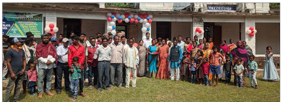
Det är roligt att byborna runt Jagriti Vihara är så engagerade i skolan. Här vid invigningen av den nya barnskolan, 15 oktober 2023.