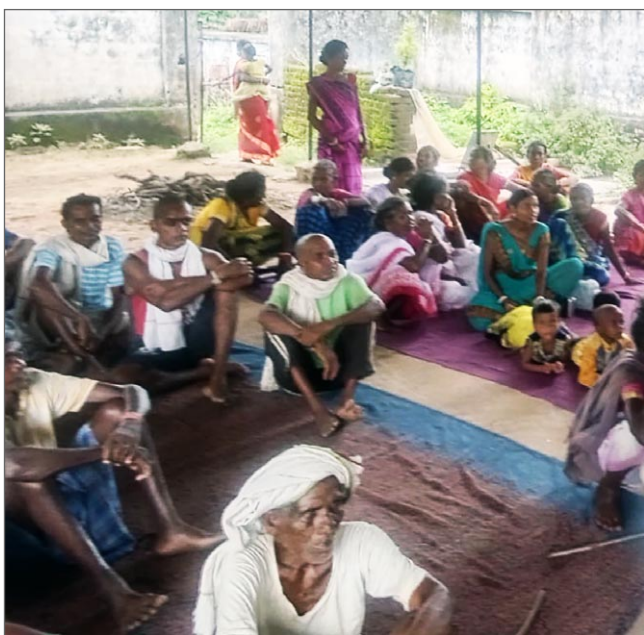
Möte i en av byarna intill Jagriti Vihara.

Nästa vecka kommer vi att sitta tillsammans och göra budgetplaner för detta projekt. I början kommer vi att starta skolan med minst 50 elever upp till klass 5 och varje år kommer antalet elever att öka. Vi förväntar oss lite stöd från föräldrarna också.