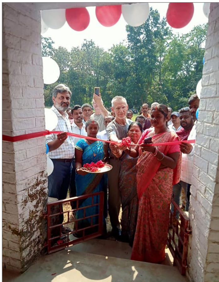
Skolstarten högtidlighölls med ballonger och klippning av band.