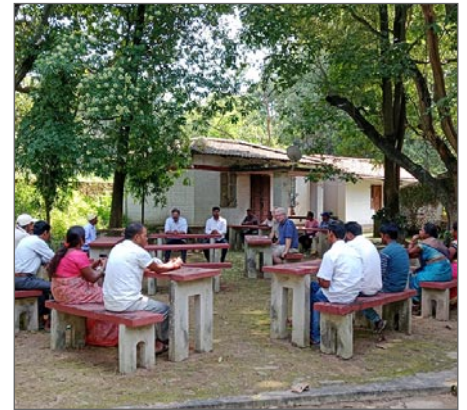
Stormöte. Staffan och Markku sitter mitt i. Hur mycket förstår de av språket?