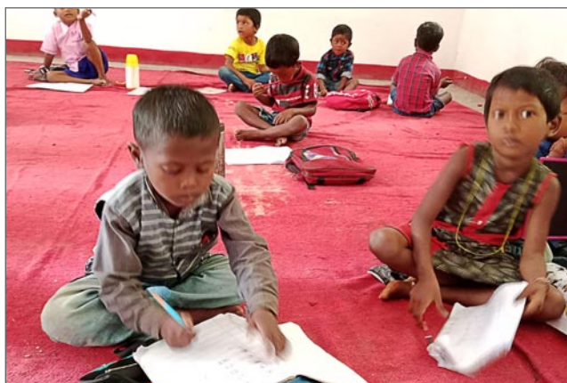
Skolbarnen sitter lika gärna på golvet som i bänkar.