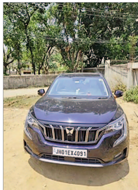
Den nya Mahindran.