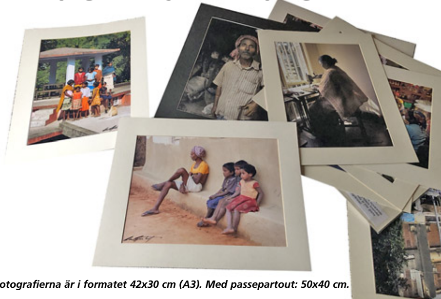
Fotografierna är i formatet 42x30 cm (A3). Med passepartout: 50x40 cm.

Under höstterminen 2010 följde jag en terminskurs på Ljungskile folkhögskola som kallades Världens kurs. Den genomfördes då som en distanskurs, men de tre veckornas studieresa i Indien var full av närvaro.