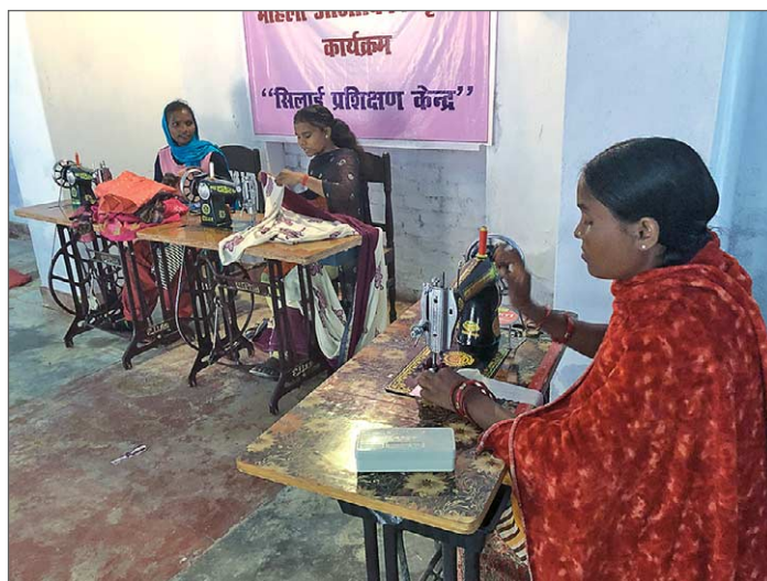
Kvinnor i byarna har tillgång till syrummet när som helst. De vet var nyckeln finns. Än så länge finns bara tre maskiner, men fler kommer att inköpas.

Ett första steg i det nya projektet var att berätta för kvinnor i grannbyar att möjligheten nu finns att lära sig sy och få tillgång till en symaskin. Denna information ger Lucy, som bor på Jagriti Vihara och organiserar självhjälsgrupper och känner till förhållandena i byarna vida omkring. Hon har god överblick vad gäller problem och hur de kan åtgärdas. En inte oviktig effekt