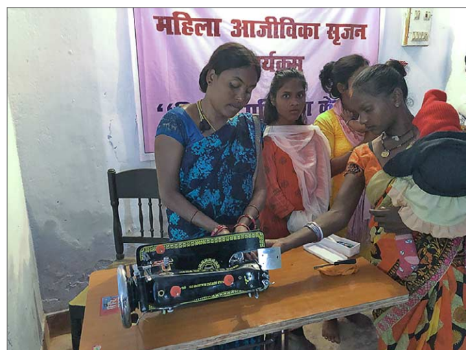
Skräddaren Mr. Ekram från Lapra har lärt upp några kvinnor, som sedan kan vidarebefordra kunskaperna till andra.