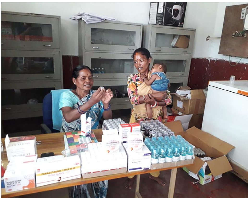
I sjukstugan på Jagriti Vihara finns ett rikt förråd av mediciner.

På Jagriti Viharas område ligger sedan ett 10-tal år tillbaka en sjukstuga. Den kom till som resultat av att några amerikanska collegestudenter besökte platsen och bland andra mötte Jaya. De fick klart för sig vilka oerhört stora problem många av byinvånarna runt Jagriti Vihara hade för att få tillgång till sjuk-