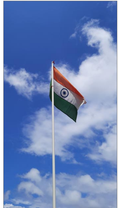
Indiens flagga. 75 år av självständighet.