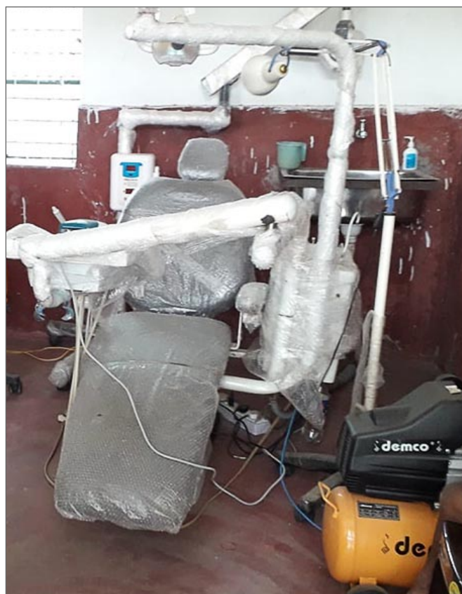
Tandläkare Ocins arbetsstol har just kommit till sjukstugan på Jagriti Vihara. Den är inte upppackad än.

Augustimålet avslutas med följande text: »We express our sincere thanks and gratitude to you and JVV Sweden for supporting us during the difficult time. We are doing all possible efforts to keep JV alive and active« (Vi uttrycker vårt uppriktiga tack och tacksamhet till er och JVV Sverige för att ni