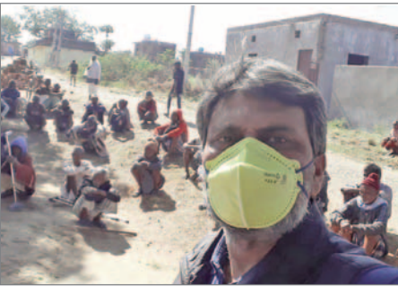
Munskydd anbefalles, men alla har inte tillgång till det.

För närvarande upplever Indien en förödande våg av Covid-19-pandemi. Över 400 000 nya fall av Covid-19 och cirka 3 000 dödsfall har noterats under det senaste dygnet. Detta är de högsta talen som registrerats i något land på 24 timmar. Det har varit ett enormt tryck på hälsoinfrastrukturen. Ett bräckligt och fragmenterat sjukvårdssystem i vårt land är på väg att ge upp. Sjukhusen har blivit överbelagda och tvingats säga nej till mängder av patienter. Det finns inte tillräckligt med sängar.