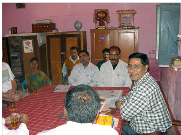
Lärare vid skolan i McCluskieganj. Rektorn längst till höger.