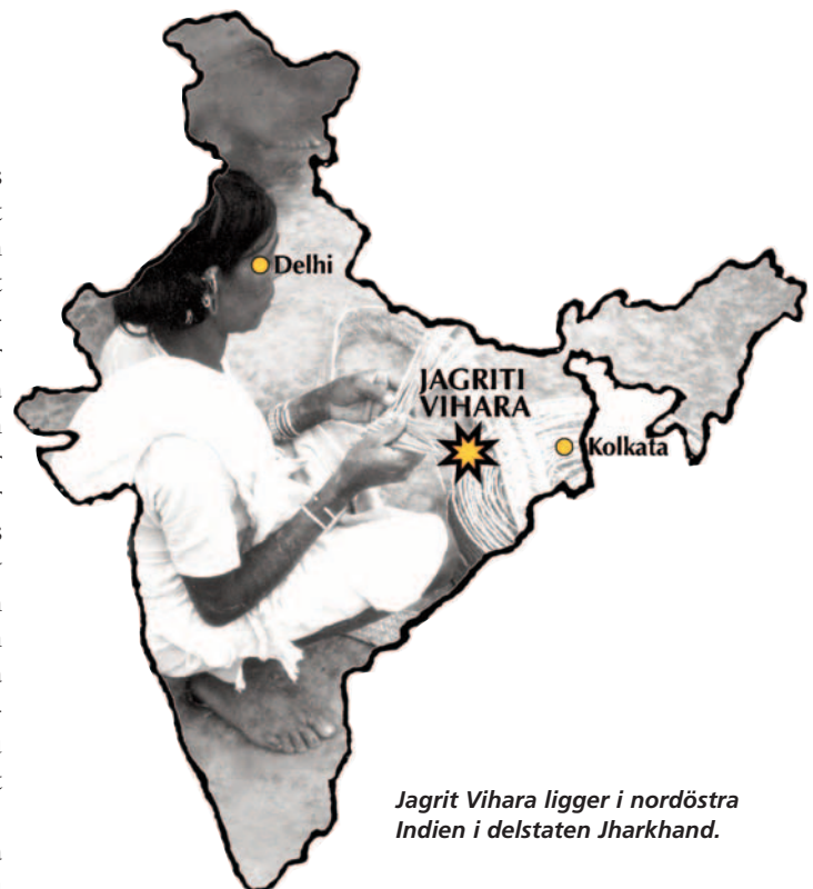
Jagriti Vihara ligger i nordöstra Indien i delstaten Jharkhand.

I tidigare mail har vi fått bekräftat att inga av de personer som finns på JV har blivit smittade av Covid-19.