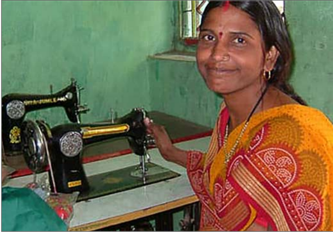
Projektet har inte startat än. Bilden är från Läkarmissionen.

Från Jagriti Vihara har vi fått en projektansökan, som JVV-styrelsen ställt sig positiv till. Det nya sömnadsprojektet beskrivs så här: