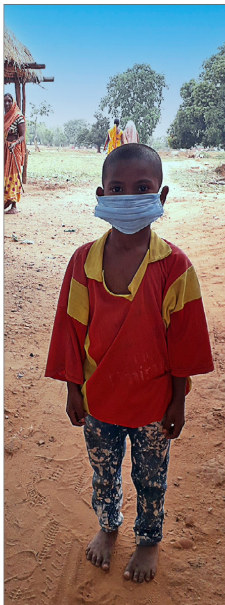
Jagriti Vihara bekämpar utbredningen av covid-19 i byarna.

Vi organiserade en hälsokontroll i en by där cirka 85 personer undersöktes av läkare och sjuksköterskor och gavs läke-