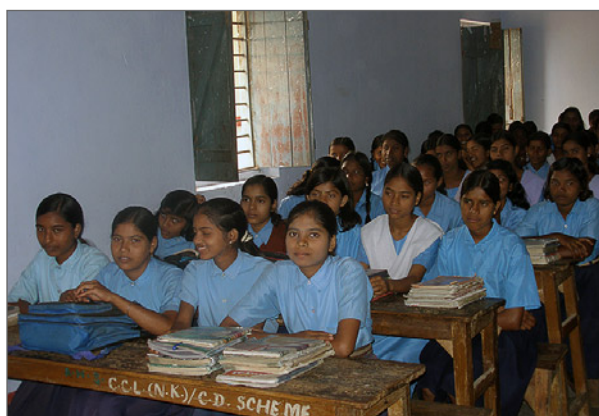
Klassrum i McCluskieganj-skolan. Det är trångt, men det fungerar ändå. Eleverna förstår att det är ett privilegium att få studera.