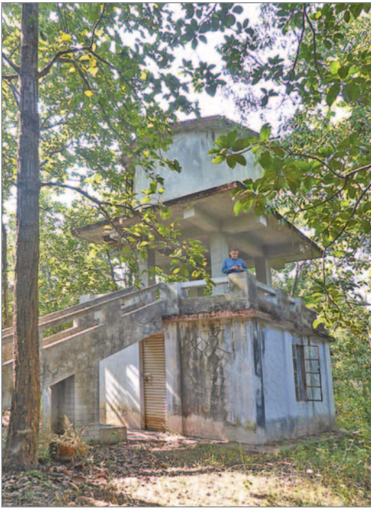
Vattentornet på Jagriti Vihara.

Jaya är lite högljudd nu, och han fortsätter: