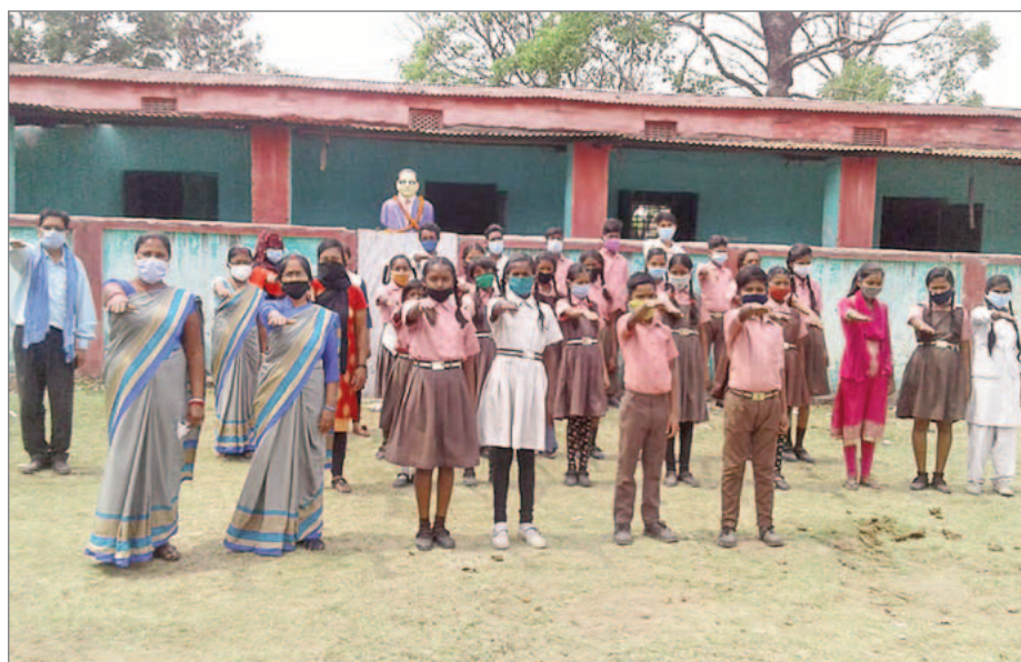
Skolbarn och lärare utanför skolan i byn Guljarbag. Här svär de en ed, att följa covid-restriktionerna och att uppmana andra att göra detsamma.