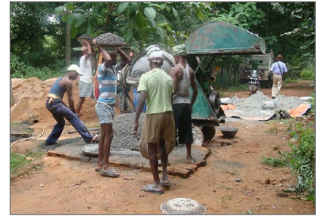
Människor vill ha arbete och på Jagriti Vihara finns många olika behov.