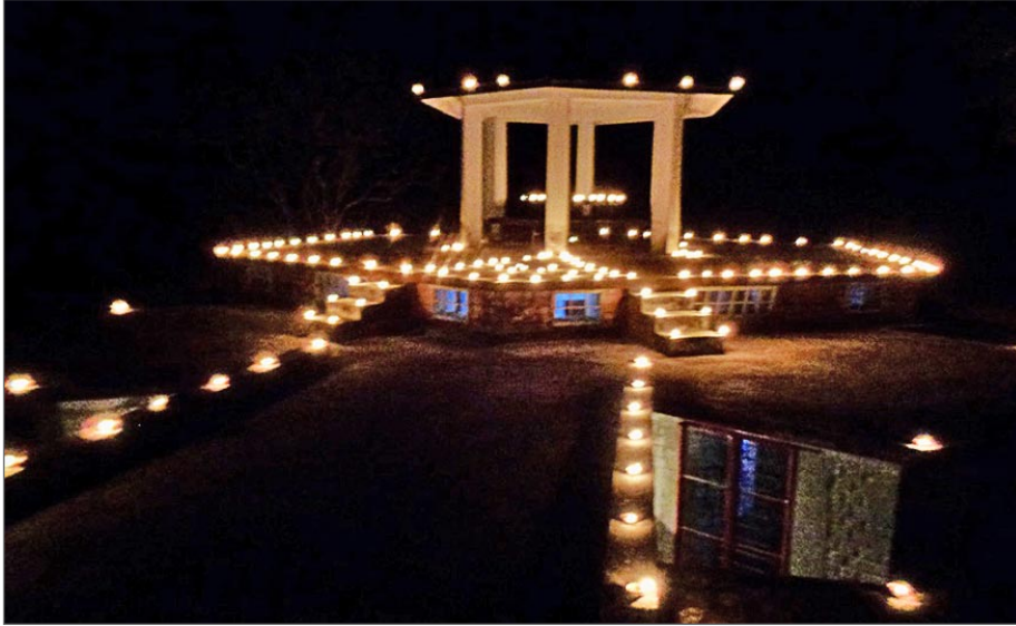
Det skulle kunna vara ett svenskt samhälle i juletid, men det är Jagriti Vihara, som firar Diwali. Hela området är smyckat med oljelampor. Här taket till matsalen.

Nu är det adventstid och husen i Sverige tycks redan ha mer ljusdekorationer än någonsin. Är det corona som ger sådana uttryck? Lys upp det som ännu är möjligt! Men ändå är vi långt efter Indien i Diwali-tid.