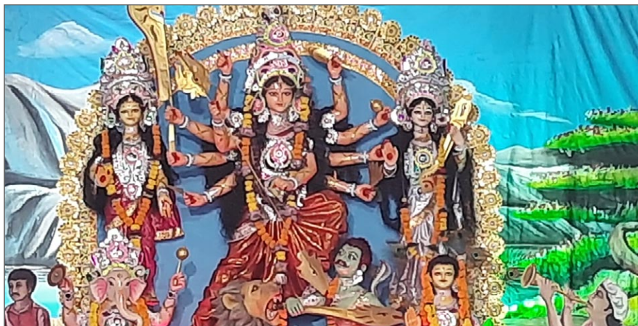
Många högtidsdagar i Indien. Före Diwali firar man Durga puja (Durga-festen).

inför Diwalifesten. Men Indiens hälso-minister uppmanade folket: »Det finns ingen anledning att samlas i stora grupper för att bevisa er tro eller er religion. Ni kan be till era gudar hemma. Jag föreslår att ni alla firar högtiderna med era familjer.«