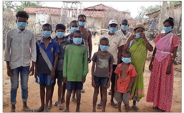
Invånare i en by i närheten av Jagriti Vihara. I Indien måste man bära mask.

Vårt arbete bygger ju på en långvarig (snart 50-årig) vänskap mellan människor från två helt olika kulturer. De flesta av JVV:s medlemmar