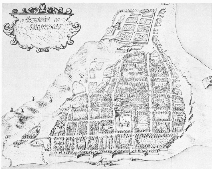
Resens Atlas, udført omkring 1660

På den anden side skulle det være opnået at få så meget samlet, som det på de givne betingelser har været muligt at registrere, således at man i dag ikke står helt uden viden om noget gammelt gadehus af betydning i Helsingørs bymidte.