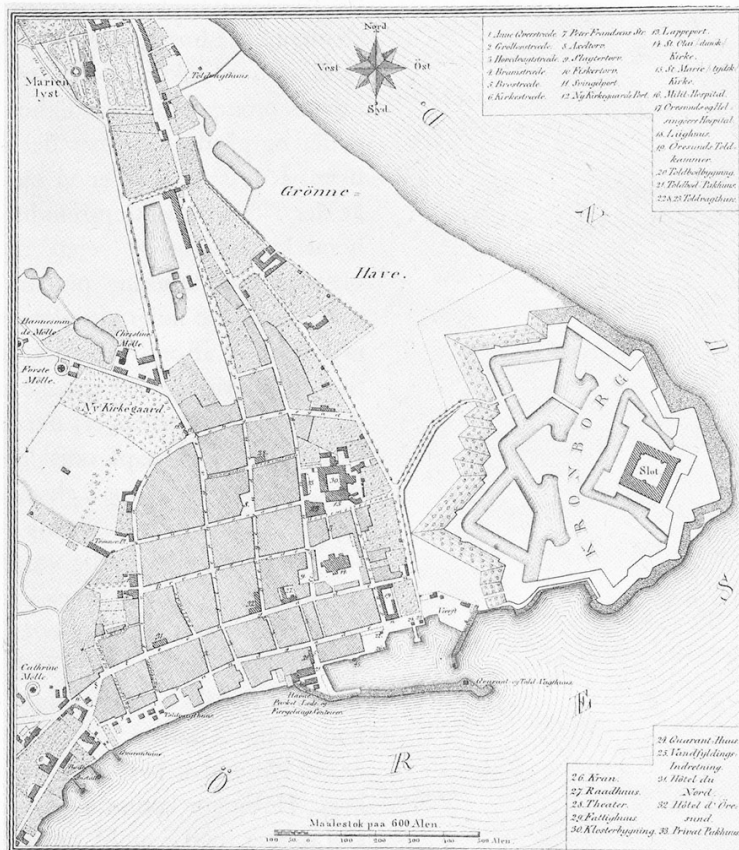
Kort over Helsingør 1845

Slutningen af 1660-årene er i Helsingør – som i næsten alle vore købstæder – en stilstands- og tilbagegangstid, og Helsingør blev ganske særlig hårdt ramt, også i begyndelsen af det 18. århundrede, da krige og pest forbitrede livet i byen. Men noget hen i det 18. århundrede sætter en rig udvikling ind, og vi får et byggeri med fine prøver på næsten alt det, der rører sig i dansk arkitektur fra Christian den 6.s tid og århundredet ud. Ja, ikke blot i dansk arkitektur; det svenske konsulat (Stengade 46) er tegnet af en svensk hofarkitekt og står som en forpost for gustaviansk arkitektur. At fremmede handelsmænd – navnlig englændere – også har været med til at præge byen er sikkert nok, men det har vist først og fremmest givet sig til kende i husenes indre.