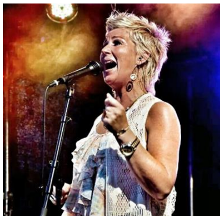
FUNKY DIVA EZZ

Hebben jullie al gedacht aan het entertainment op jullie bruiloft? Wij kunnen vanuit Jp1886 een divers entertainment aanbieden. Jullie zijn ook vrij om zelf een DJ en/of band te regelen. Op aanvraag kan gebruik gemaakt worden van een LED scherm van Jp1886 (eigen laptop meenemen).