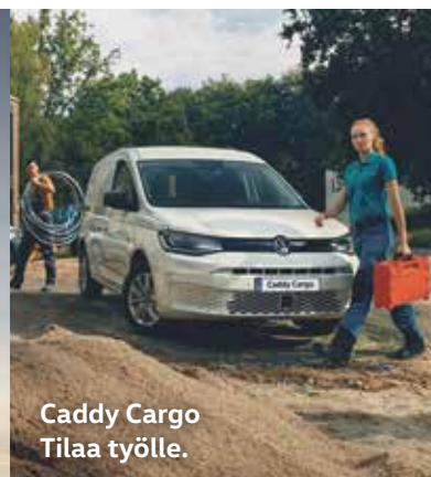
Caddy Cargo Tilaa työlle.