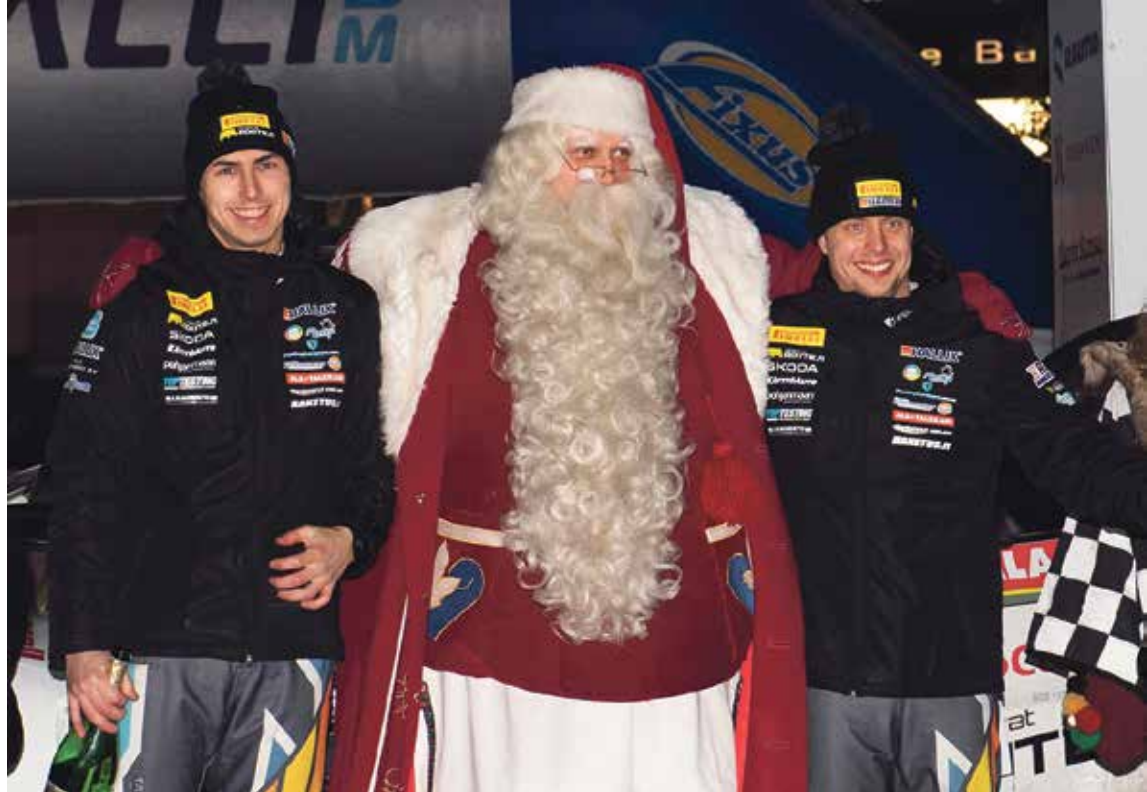
Asunmaa ja Mannisenmäki juhlistivat viime vuoden Tunturi-rallin voittoa yhdessä tutun parrakkaan hahmon kanssa.

ABC Kemijärvi Pajulantie 2 98100 Kemijärvi, puh. 050 311 7858 AVOINNA ma-la klo 6-22 su klo 8-22