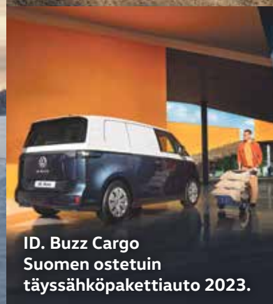
ID. Buzz Cargo Suomen ostetuin täyssähköpakettiauto 2023.