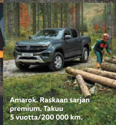
Amarok. Raskaan sarjan premium. Takuu 5 vuotta/200 000 km.

Meiltä saat palkitut pakettiautot, henkilöautojen tilaihmeet ja kodikkaat matkailuautot. Laaja mallistomme tarjoaa tehokkaat ja taloudelliset moottorit, edistyskellisimmät varusteet sekä viihtyisät sisätilat. Meidän kautta myös räätälöidyt korinrakennusversiot eri käyttötarkoituksiin. Tutustu Volkswagen jälleenmyyjällä ja osoitteessa volkswagen-hyötyautot.fi