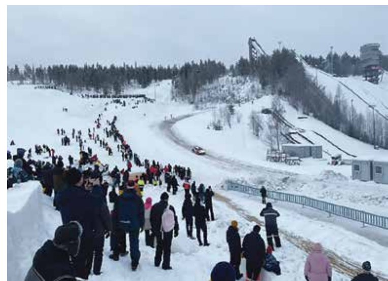
Ralliautot ajavat Ounasvaaralla laskettelurinnettä alas.

Mäntyvaaraan ja Oukulle ennakkolipun ostaneille oma sisäänpääsy portti joka nopeuttaa alueelle siirtymistä.