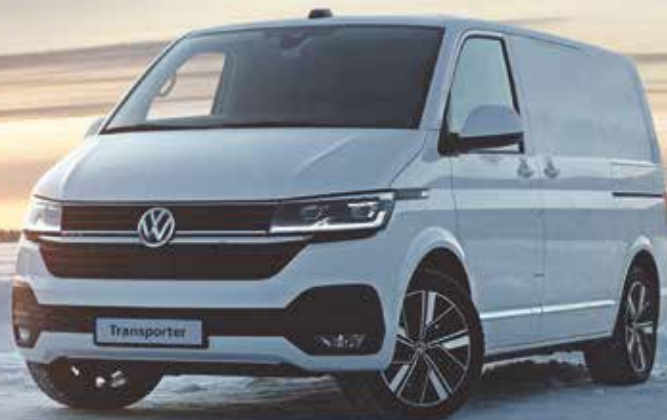
Transporter 6.1 Suomen ostetuin pakettiauto 2023.

Volkswagen Hyötyautot on vuoden 2024 Ralli SM-, Rallicross SM-, Rata-SM ja Karting SM -sarjojen virallinen yhteistyökumppani.