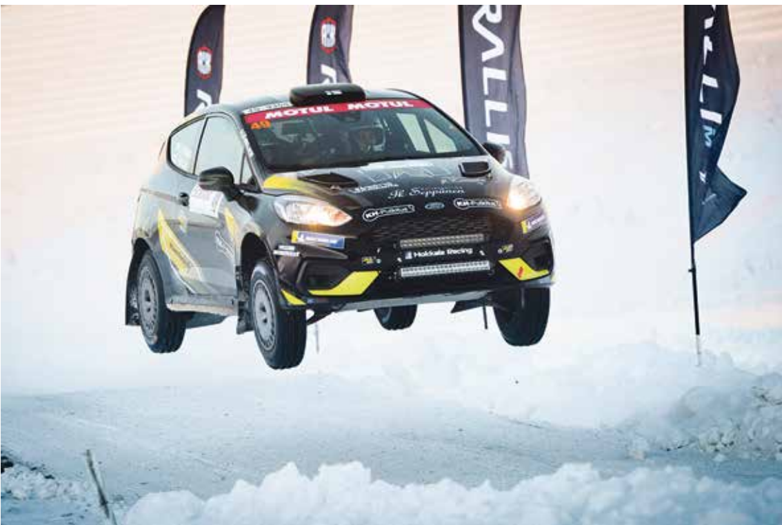
Mäntyvaaran hyppyristä hypätään korkealle ja pitkälle.

Ralliautoilun tavoitteena on ollut jo useamman vuoden ajan tulla ” ihmisten ilmoille ” eli lähemmäksi katsojia. Ralliin on yhdistetty useasti metsässä rämpiminen, talvella hangessa paleleminen ja kesällä pölyn nieleminen. Ralli voi tulla kaikkea tuota mutta se voi olla myös ” sivistynyttä ” rallin seuraamista. Lyhyitä kävelymatkoja ja ralliin seuraamista hyviltä katsomopaikoilta. Eli puhutaan ns. yleisöerikoiskokeista. Arctic Rally tarjoaa tänä vuonna Rovaniemen alueella kaksi yleisöerikoiskoetta missä rallin seuraaminen on erityisen helppoa eli Mäntyvaara ja Ounasvaara. Lisäksi Kemijärven keskustassa ajetaan ihan kaupungin keskustassa.