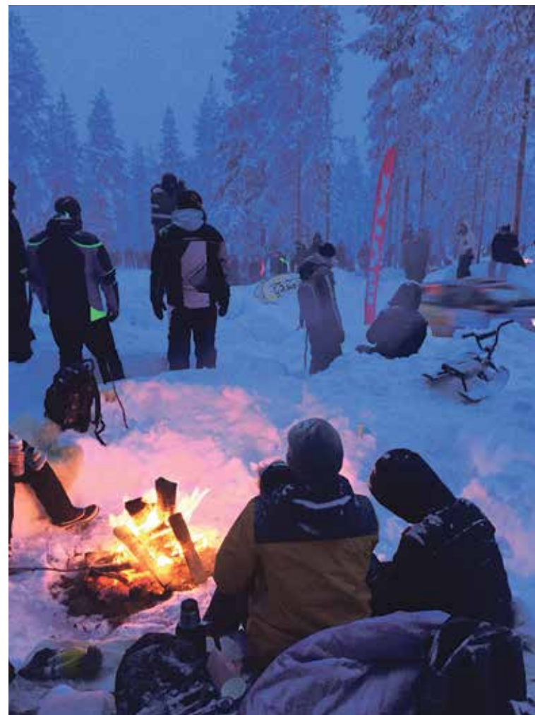
Nuotion ääressä makkaraa paistaessa on rallitunnelma parhaimmillaan

Sarriojärven yleisölle varattu katselupaikka sijaitsee Kemijärveltä 15 km päässä ja Rovaniemelle on matkaa reilut 70 kilometriä. Yleisölle on varattu upea paikka vaaran rinteestä, jossa pitkä näkemäalue. Ralliautot tulevat pitkää suoraa ja alamäkeä pitkin kapealle sillalle, jonka jälkeen tiukka jarrutus ja mutka oikealle. Hieno katselupaikka, jossa satamäärin yleisöä, nuotioita, lippuja ja plagaatteja eli rallitunnelmaa par-