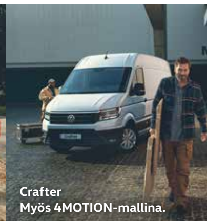
Crafter Myös 4MOTION-mallina.