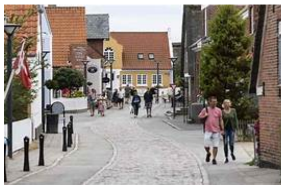
Idyllisk billede fra Sønder Ho