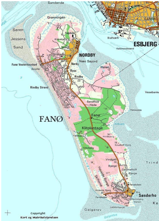
Kort over Fanø