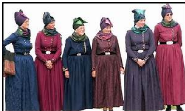
Kvinder i folkedragter