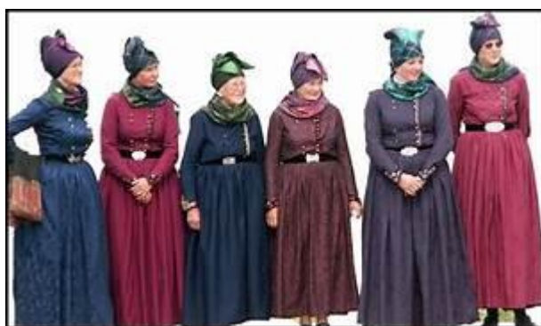
Kvinder i folkedragter