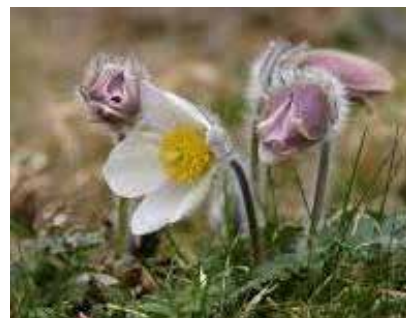
Härjedalens landskapsblomma Mosippa

Mosippa ( Pulsatilla vernalis ) är en växt som blir 5 till 20 centimeter hög och blommar i april till juni. Ganska sällsynt förekomst på öppen, torr, sandig eller grusig mark. Hybridiserar ytterst sällsynt med backsippa ( P vulgaris ).