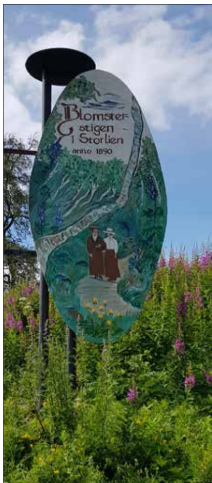
Orkidé längs Blomsterstigen