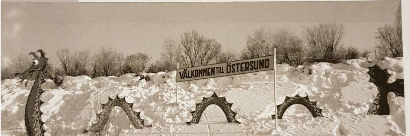
Så här hälsades deltagare och publik välkomna till skidspelen i Östersund år 1948.

SAMHÄLLSVETENSKAPLIGA FAKULTETEN | LUNDS UNIVERSITET