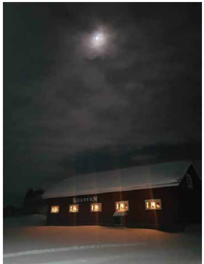
KulturN i vinterdvala