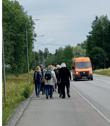
Marschen 2 km in till Hoting