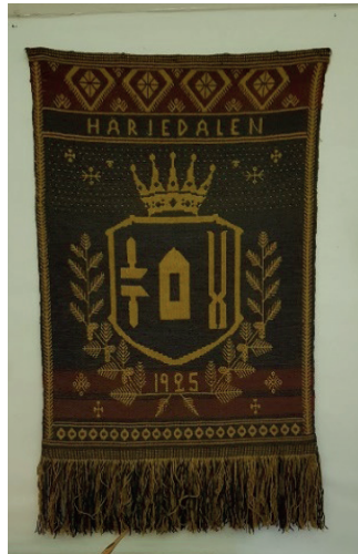
Vävnad på Gammelgården