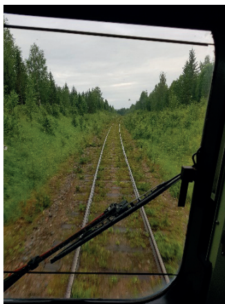
Banan på väg till Lit

Torsdagens program var tur och retur, 334 km, till Hoting, länets nordligaste station på Inlandsbanan. Tåget avgick kl. 07.40. Vädret i Hoting under dagen var nästan regnfritt! Ombord fanns Inlandsbanans tågvärd, som gav oss fortlöpande information och föraren som manövrerade ekipaget.