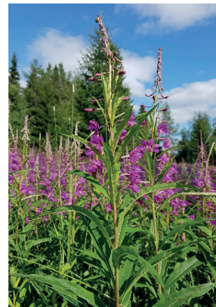
Mjölkkört nästan överallt