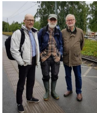
Uppställda för guidning på Jamtli De tre Ocksjö-systrarna De tre organisatörerna