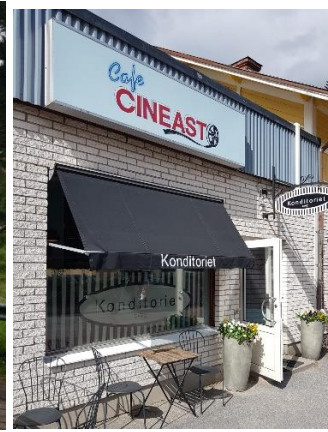
F.d. tingsnotarien på plats Mankells bro för både tåg och bil Café Cineast i Sveg

Från tingshuset var det inte långt till bron över Ljusnan för både bilar och tåg . Det är Inlandsbanan som passerar bron och förarna av tåget kan själva fälla ner bommarna som ger tåget företräde. Bron har fått namnet Mankells bro och en liten skylt med citat från författaren är uppsatt. Det kom lite regnstänk så att de som för säkerhets skull tagit med paraplyer tog fram dem. Men det var kort och övergående varför även Svegs-dagen gynnade oss med lämpligt väder.