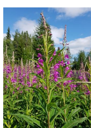
Banan på vägen till Lit Heike tågvärd Alexander tågförare Mjölkkört nästan överallt