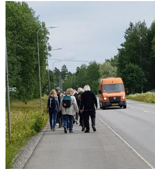
Fika vid Hoting Camping och huset med Hoting Forn tid 2 km promenad till Hoting