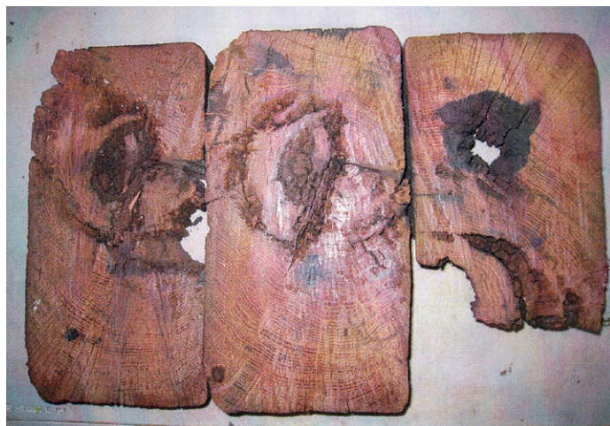
Træstykkerne af egetræ fra ca. 1672 med huller efter borebiller

Da der er tale om en prøve taget fra en støttestbjælke, som er indsat for at understøtte de bærende loftsbjælker, kan disse godt være ældre. Hvis økonomien tillader det, vil Nationalmuseet i løbet af foråret udtage prøver af selve bjælkerne for at fastslå alderen på denne del af bygningen.