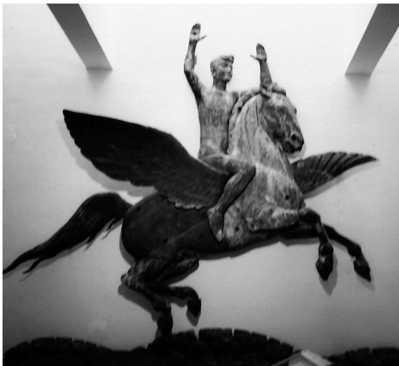
Den originale Pegasus fra 1898 på Willumsen Museet i Frederikssund