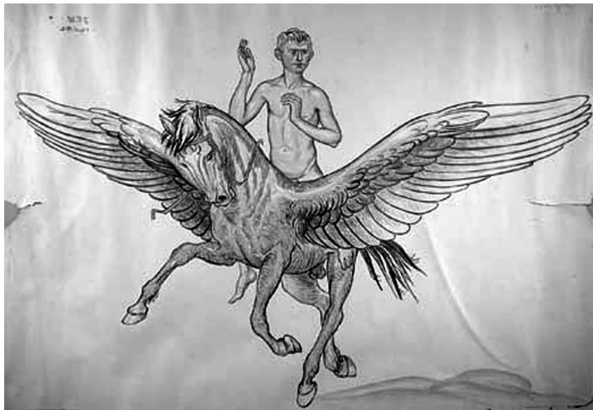
Willumsen: Dreng på Pegasus. 1902. Farvelitografi, ca. 62 x 85 cm