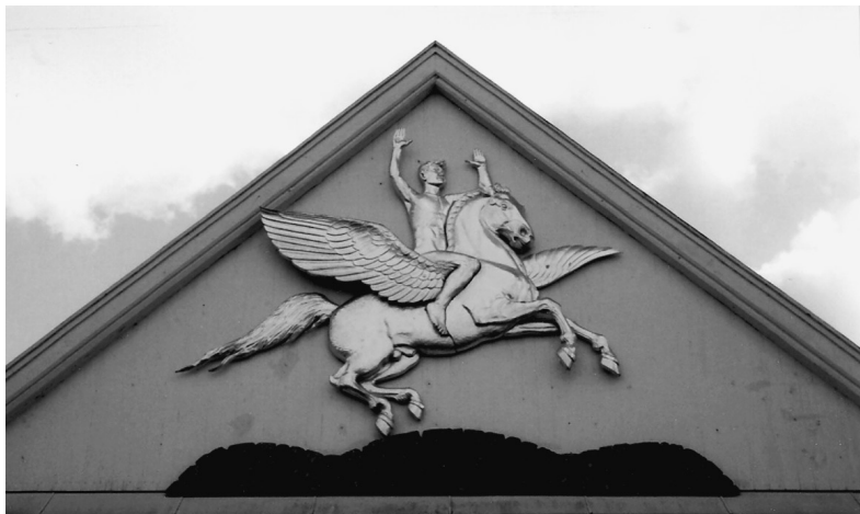
Den ny Pegasus kopi skabt under restaureringen i årene 2002-06