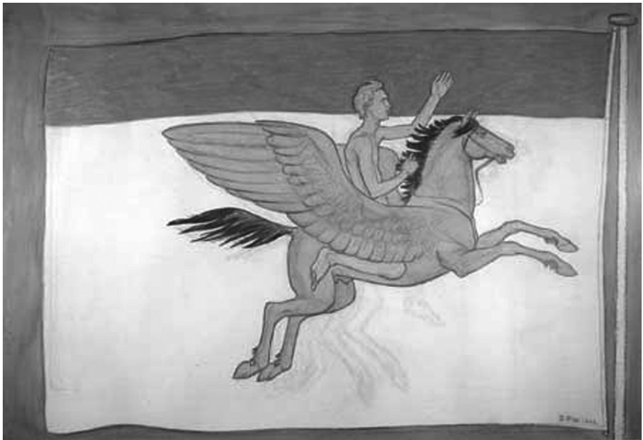
Udkast til fane for Den Frie Udstilling (1902). Gouache og blyant på papir, 63 x 91 cm